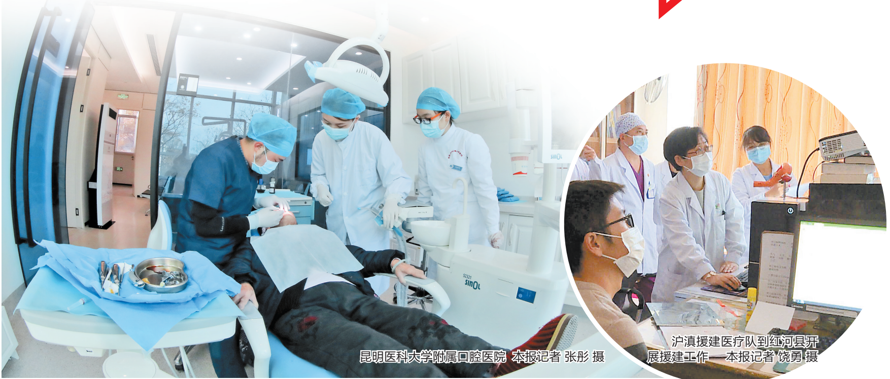
昆明医科大学附属口腔医院

化经办服务中推动高质量发展。一项项惠民政策接连出台、一桩桩医保实事落地生根、一张张医疗保障安全网正在织密筑牢,百姓看病就医的底气越来越足。截至2021年底,全省基本医疗保险参保人数4585万人。