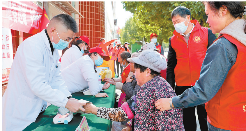
昭通市第一人民医院到社区义诊