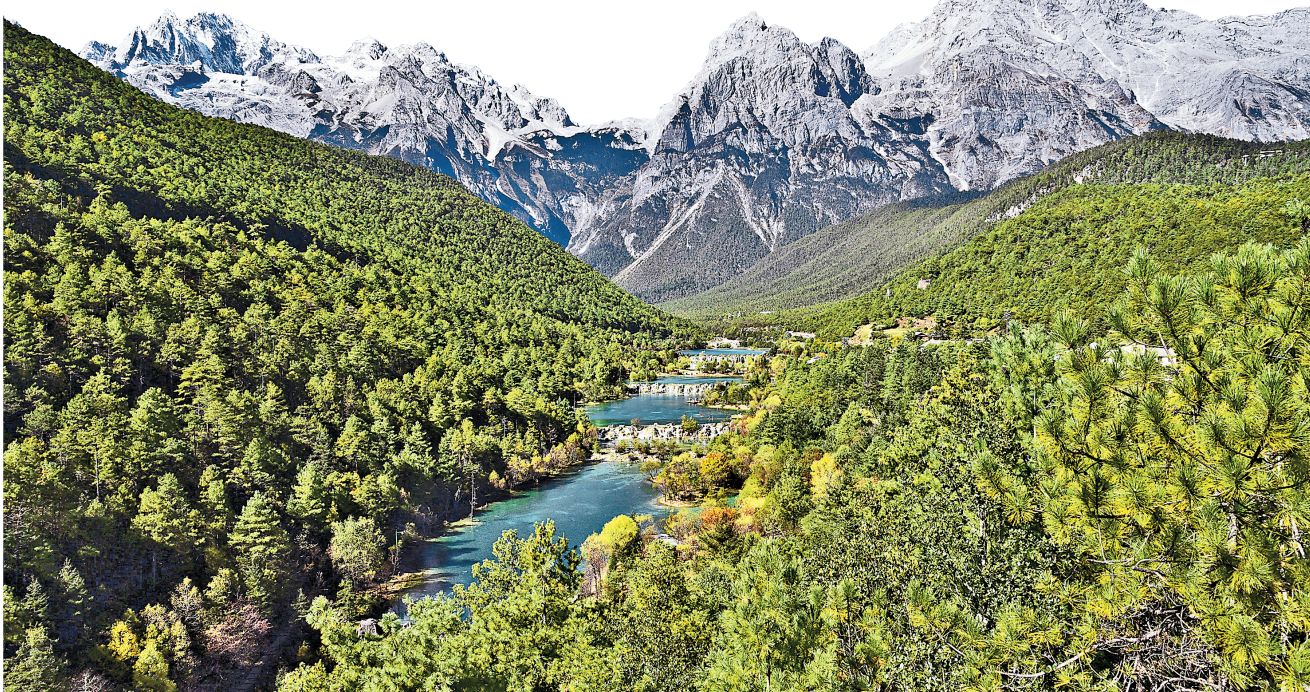
玉龙雪山自然保护区

近年来，丽江市牢固树立“绿水青山就是金山银山”理念，坚持生态优先、保护为主、综合治理、绿色发展、生态惠民、问题导向、因地制宜，全面推行林长制，深入开展林长巡林检查督导，切实担负起林草资源保护发展责任，全力探索具有丽江特色、系统完整的生态文明建设制度体系，把丽江建设成为长江上游重要生态安全屏障。截至目前，市、县(区)、乡(镇、街道)、村(社区)四级林长制体系全面建立，林长制框架基本形成。