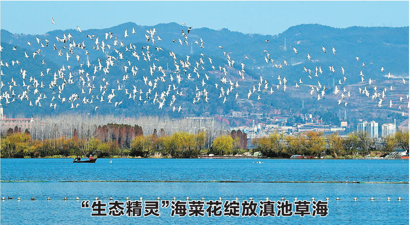
“生态精灵”海菜花绽放滇池草海

连日来,滇池草海大泊口水域“生态精灵”海菜花绽放,苦草、金鱼藻等水生植物长势喜人。从2018年以来,滇池水质连续3年达到Ⅳ类,大泊口湖泊水生态修复与水质改善、稳态转化技术示范工程也成为滇池保护治理的缩影。