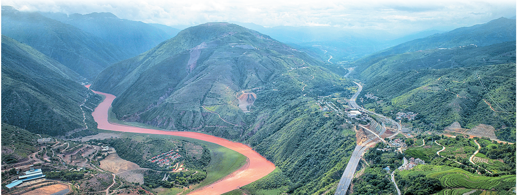
四通八达的交通网络

本期导读 履职尽责 共谋发展 建言资政 凝聚合力 详见第十版 铭记光辉历史 走好赶考之路 详见第十一版 担当实干闯新路 争先跨越立潮头 详见第十二版