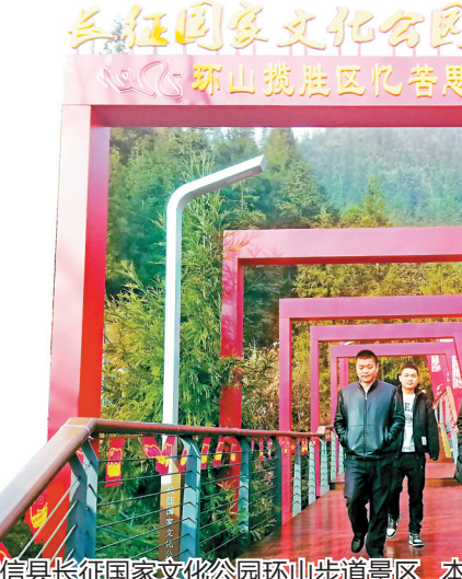
威信县长征国家文化公园环山步道景区

积极培育新兴产业。实施高新技术企业“三倍增”行动，扶持发展新材料、生物医药、信息技术、高端装备制造、新能源、节能环保等战略性新兴产业，以场景应用为抓手，实施数字经济产业发展行动计划，推动数字赋能行业发展。推进信息网络提质覆盖，建设大数据中心、工业互联网等新型基础设施，培育5家以上跨行业跨领域数字应用平台，拓宽数字技术在公共服务、社会治理、乡村振兴等领域的应用，赋能传统产业数字化转型，实现产值100亿元以上。