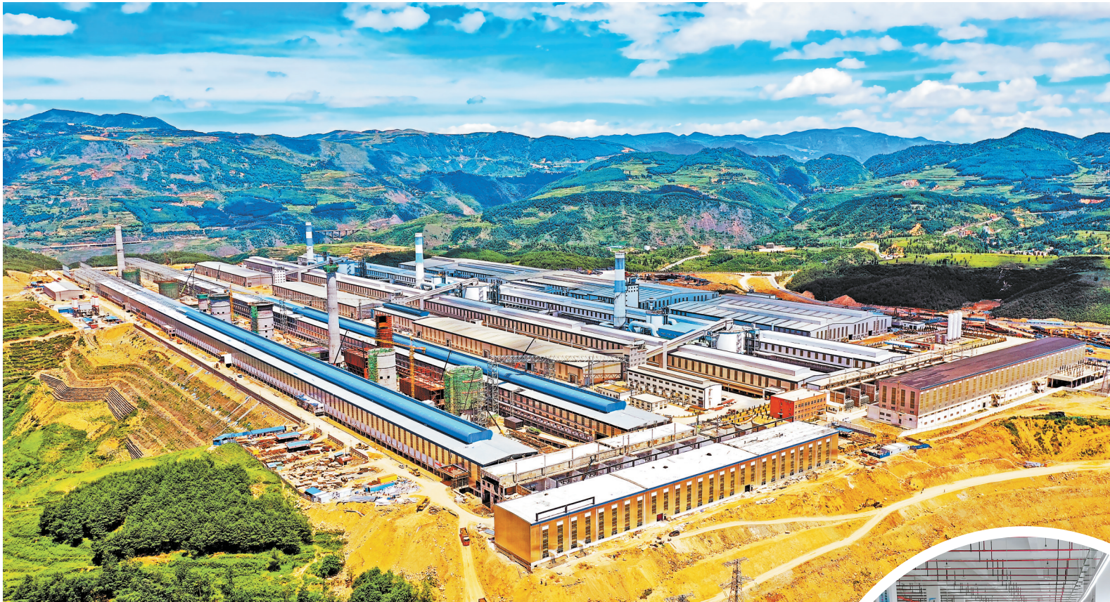
年产70万吨绿色水电铝项目 供图

踔厉奋发开新局，笃行不怠谱新篇。站在新发展阶段，昭通要实现更高质量跨越发展，就是要在大力实施乡村振兴、产业兴市、交通强市、城乡融合、生态优先、人才支撑新的“六大战略”中，聚焦“六个着力”，奋力开创昭通新时代高质量跨越发展新局面。