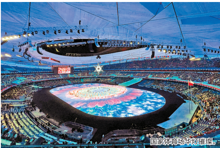
国家体育场华灯璀璨。