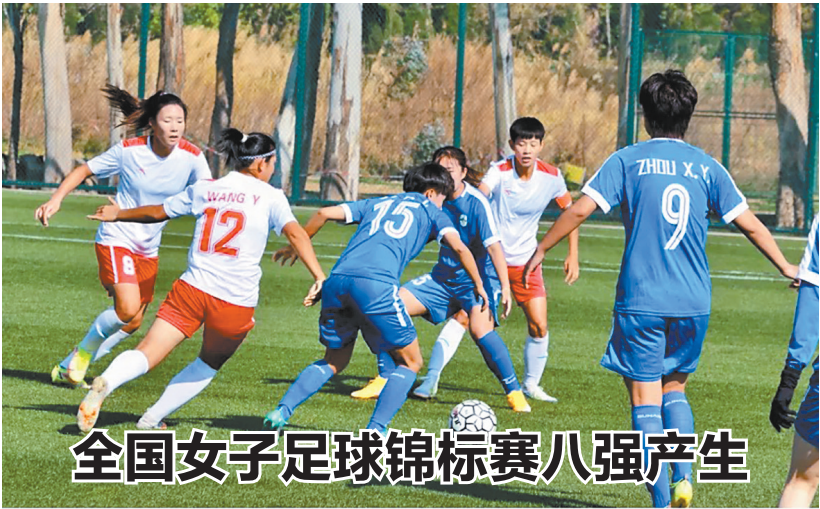
全国女子足球锦标赛八强产生

本报讯(记者 姜莹)3月16日,2022年中国足球协会全国女子足球锦标赛在昆明海埂体育训练基地结束小组赛争夺,八强席位随之产生。