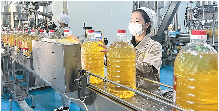
云南滇雪粮油有限公司生产车间

红塔区坚持深化改革,破难题添动力,发展活力持续增强。以改革创新思维的思和办法,坚决破除发展道路上的藩篱。深化“放管服”改革,“一颗印章管审批”覆盖全区13个部门174项事项。“一部手机办事通”、政务服务全程电子化等改革稳步推进。数字赋能营商环境优化,建成一站式惠民“互联网+政务服务”平台,实现“一网通办”,政务服务事项网上可办率达100%、全程网办率达83.4%。营商环境各项指标居全市前列。同时,启动