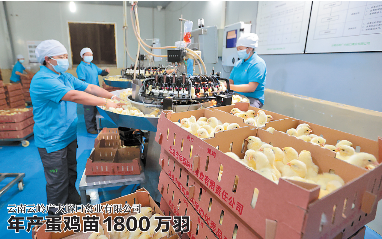
云南云岭广大峪口禽业有限公司 年产蛋鸡苗1800万羽

云南云岭广大峪口禽业有限公司位于开远市乐白道办事处乍黑甸村,占地210亩,以蛋鸡养殖、蛋鸡苗及鲜蛋生产销售为主。公司现存栏饲养父母代蛋种鸡30万套,年生产优质商品蛋鸡苗规模达1800万羽,产品远销省内及贵州、广东、广西等地,是我省最大的父母代蛋种鸡养殖、孵化、销售示范基地。