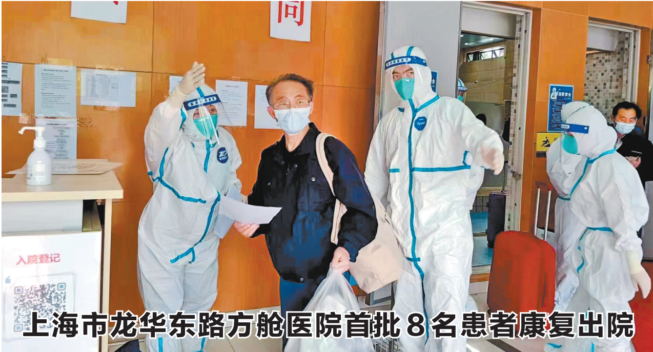
上海市龙华东路方舱医院首批8名患者康复出院

本报上海专电(特派记者 陈鑫龙 黄兴能)4月27日,由云南援沪医疗队接管的上海市黄浦区龙华东路方舱医院首批8名患者康复出院。