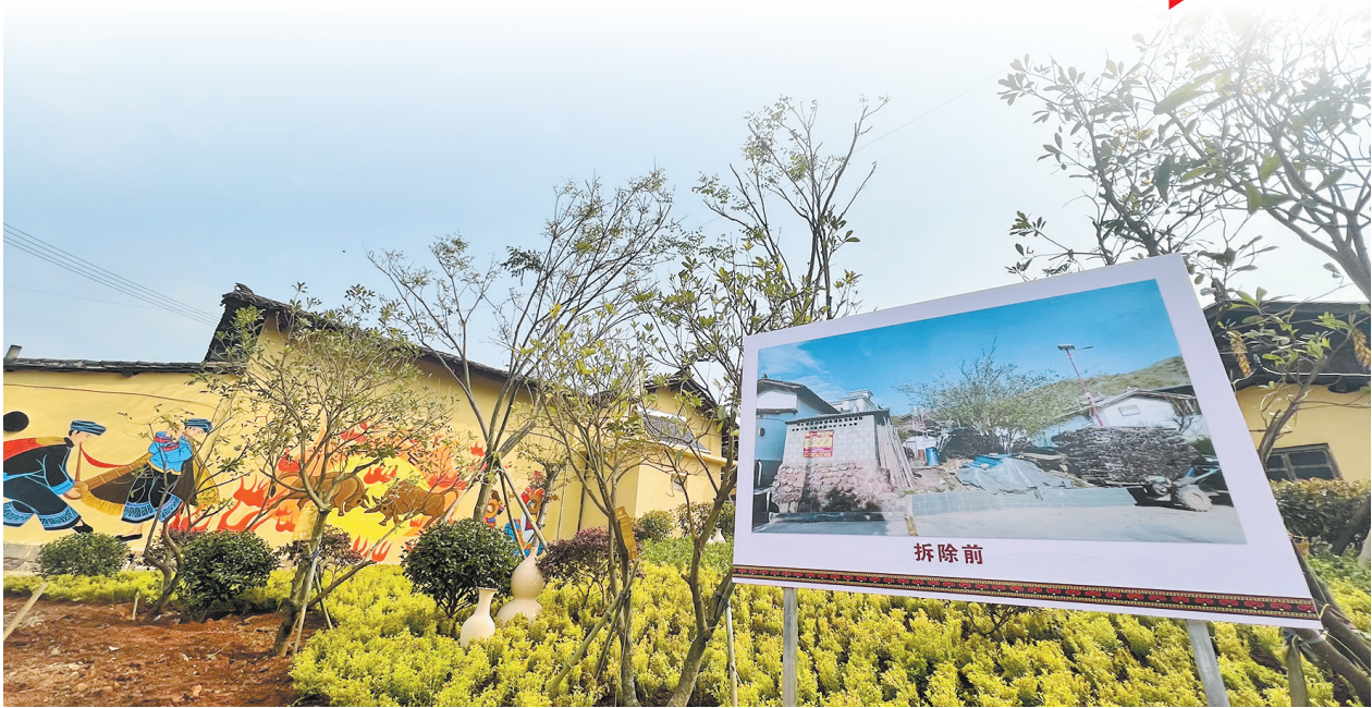
峨山路口组经改造变美了

近年来，峨山县在玉溪市率先开展农村危房闲置旧房安心拆除，有效破解了农村“人走屋空”“建新不拆旧”等“老大难”问题，大力推进拆后土地多元化利用，为建设美丽乡村腾出空间，积极探索农村集体土地赋能增效的乡村振兴之路。