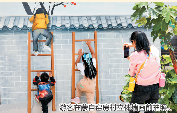
游客在蒙自窑房村立体壁画前拍照。