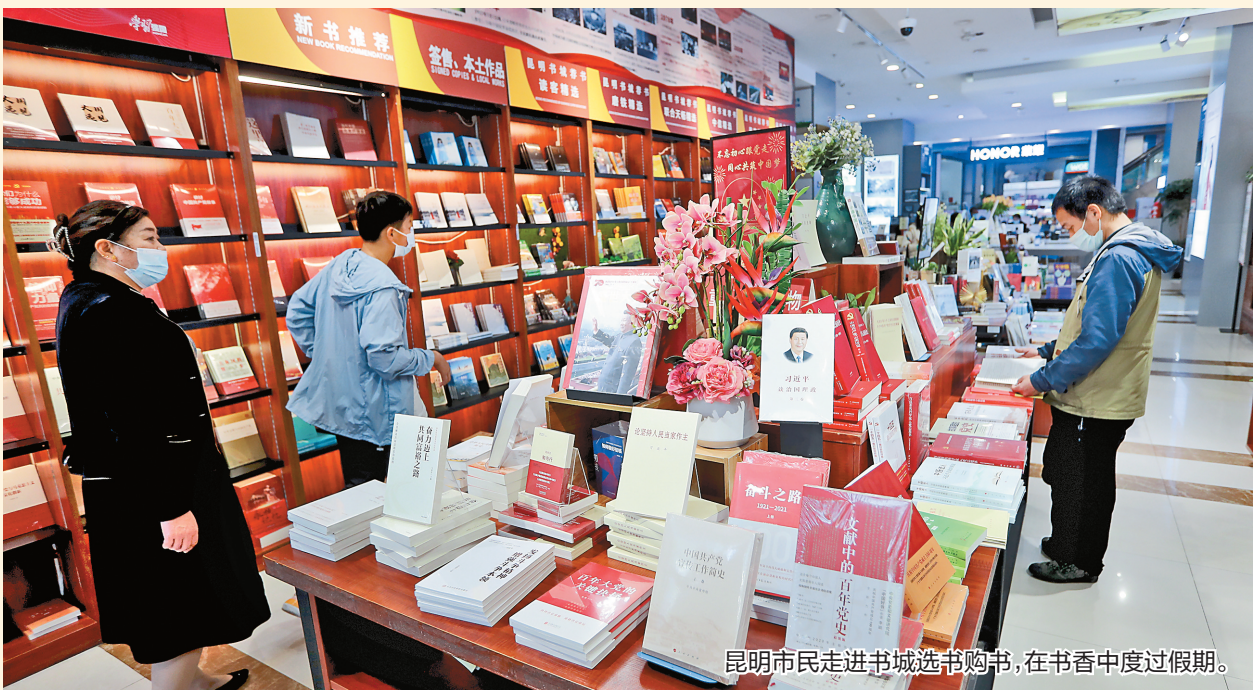
昆明市民走进书城选书购书,在书香中度过假期。