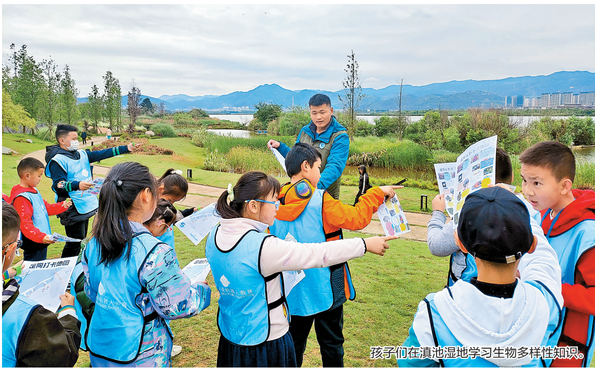
孩子们在真地湿地学习生物多样性知识。

本报讯(记者 刘子语)“五一”假期,我省各地本地游活动有声有色。文旅部门、景区景点、旅游行业协会等发出文明旅游倡议,得到积极响应。在各方共同努力下,绿色出行、文明出行让小长假愉悦舒心。