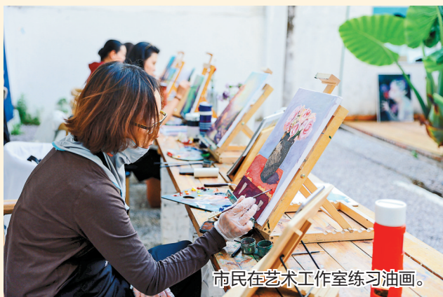
市民在艺术工作室练习油画。