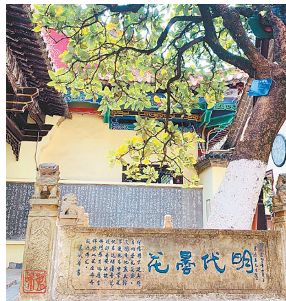
昆明昙华寺内的明代优昙树

明、清年间,昆明有一施姓科举世家,族中曾出举人十余人。时人颂扬施氏家风清正、惠爱一方,淡泊明志、沉毅有骨。施家良好家风的背后,起到巨大作用的是被史书评价为“正直不阿,一代名臣”的先贤施昱。