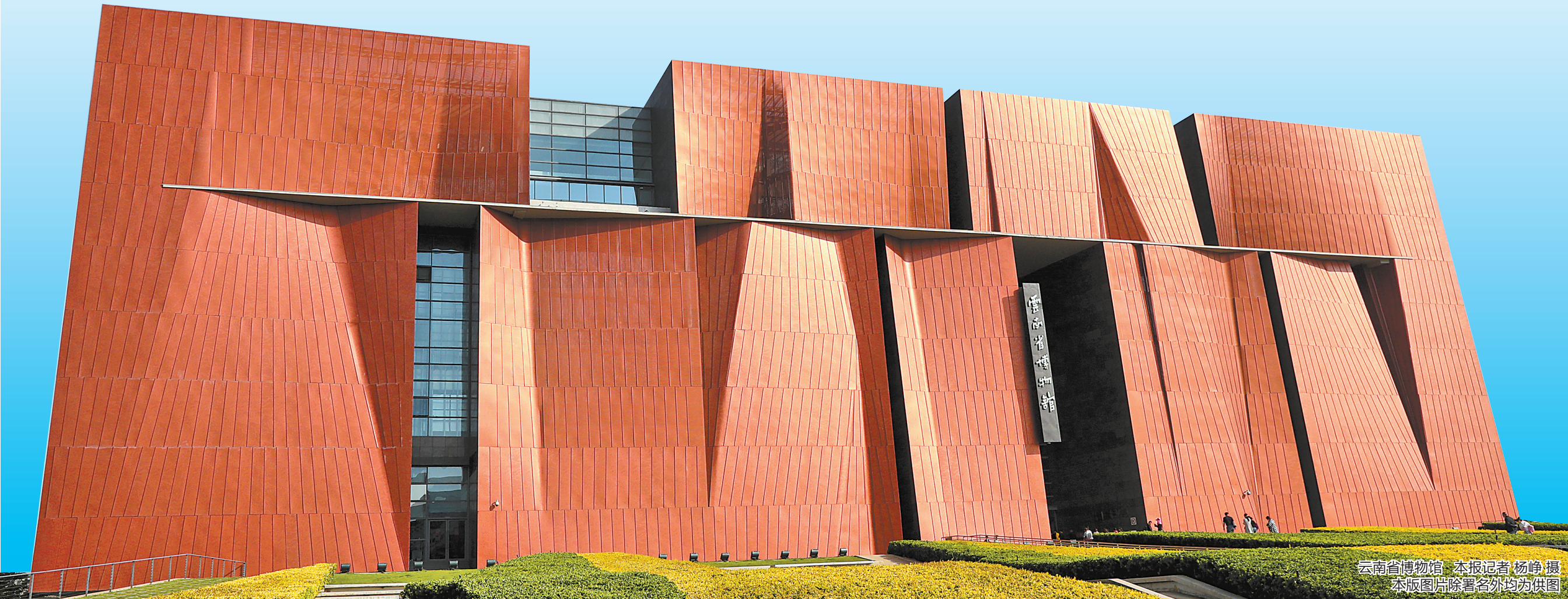
云南省博物馆 本报记者 杨峰 摄 本版图片除署名外均为供图