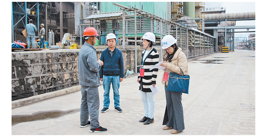
寻甸县纪委监委督查组深入企业了解优化营商环境政策落实情况。

寻甸回族彝族自治县纪委监委坚持“室组地”联动,抽调纪检室、纪检组、乡镇纪委相关人员成立单元制监督检查组,对职能部门及企业开展地毯式监督检查,助力营商环境优化提升。 为确保监督检查取得实效,检查组坚持与企业家和群众进行一对一访谈,重点了解惠企政策落实情况,收集企业关于规范政商交往、优化营商环境的意见建议。坚持不定期下沉检查,及时发现政策执行中存在的薄弱环节和突出问题,着力解决干部队伍以权谋私、权钱交易、吃拿卡要等阻碍制约优化营商环境等问题。 针对企业提出的意见建议,纪委监委督促职能部门提供“店小二”“保姆式”优质便捷服务,主动服务、靠前服务、精准服务,针对企业痛点,逐一“把脉问诊”,一企一策、一项目一方案解决问题,把政策落实到每一个企业。 该县纪委监委还建立了涉企线索处置绿色通道,对涉企问题线索单