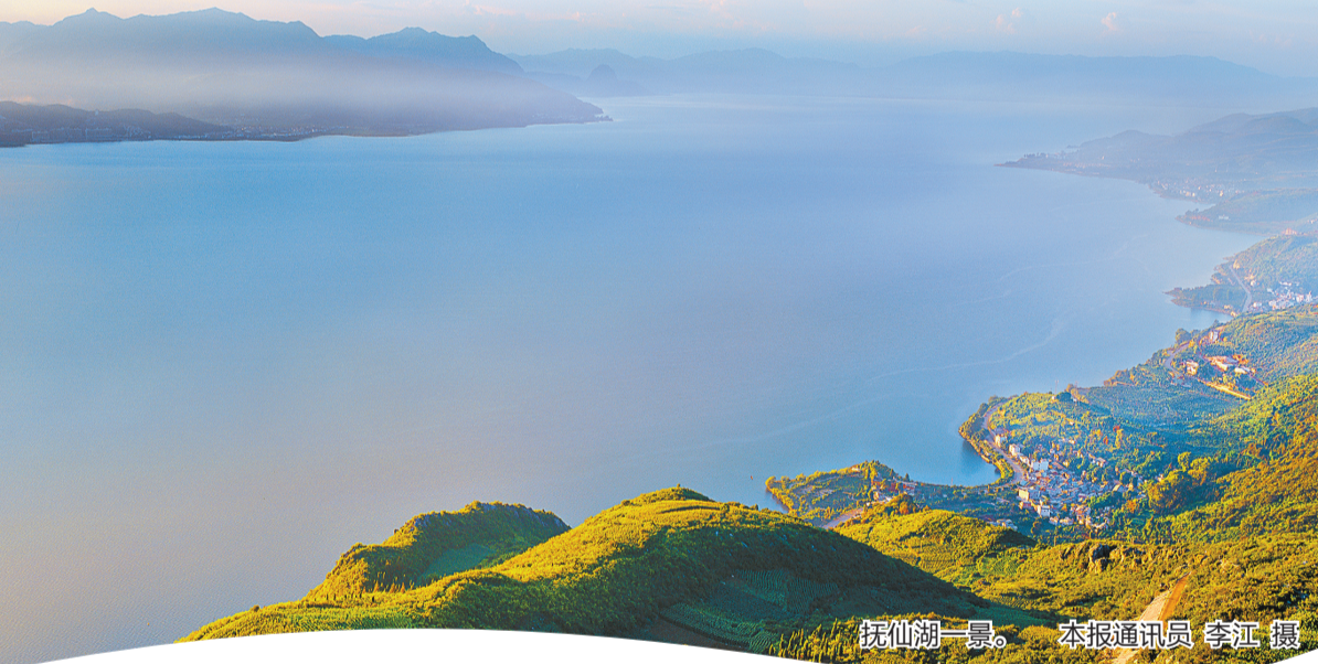
抚仙湖一景。

本报讯(记者 浦美玲)自抚仙湖径流区截污治污工程实施以来,澄江市咬定“不让一滴生活污水流入湖泊”的目标,将“精准”二字贯穿截污治污工作始终,全力推进工程建设进度,确保截污治污工程见实效。