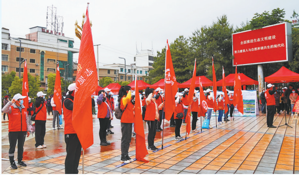
澄江市科普周启动仪式