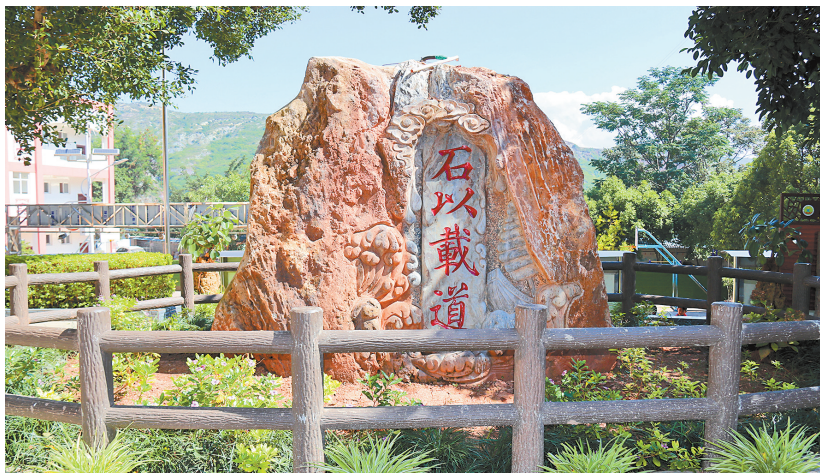
学校中陈列的巨石