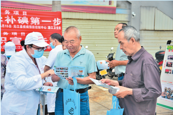
元江县多部门联合开展宣传活动

科普周期间，玉溪各地开展了贴近实际、贴近群众、贴近生活的科普宣传活动，群众反响热烈，营造了全社会学习社科知识、认识社会科学、热爱社会科学、运用社会科学的浓厚氛围，人与自然和谐共生的理念逐渐深入人心。