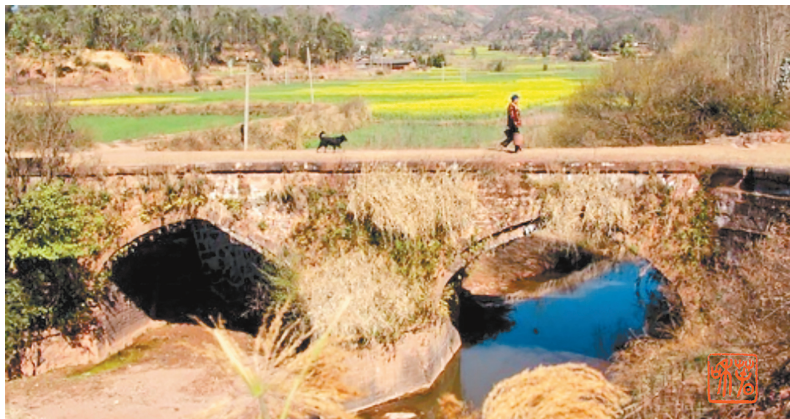
明代李贄主持修建、已成为云南省重点文物保护单位的姚安连厂桥

自古以来，云南省姚安县涌现了许多品正学高，治政有方，名留青史的官吏。其中，明代姚安知府（俗称姚安太守）李贄是一位清正廉洁，造福百姓的好官。李贄（1527年—1602年），字宏甫，号卓吾，别号温陵居士，百泉居士等，福建泉州晋江县人，为明代著名思想家、文学家。万历五年（1577年）赴任姚安军民府知府（正四品），施政秉承“务以德化民，不贵市俗能声”（民国《姚安县志》，下同），居官素以“法令清简，不言而治”安民养民，“一切持简易，任自然，务以德化”而“自治清苦，为政举大体”，体察民情，遂在府衙上书写了“从故乡而来，两地瘡痍同满目；当兵事之后，万家疾苦总关心”和“听政有余闲，不妨运陶斋，花栽潘县；做官无别物，只此一庭明月，两袖清风”。李贄用两副对联自勉，并以此为镜，为民造福。为缅怀先人，2006年姚安县社会各界纷纷自发捐资，在县城梅葛文化广场铸立了李贄铜像，弘扬清正廉洁精神。