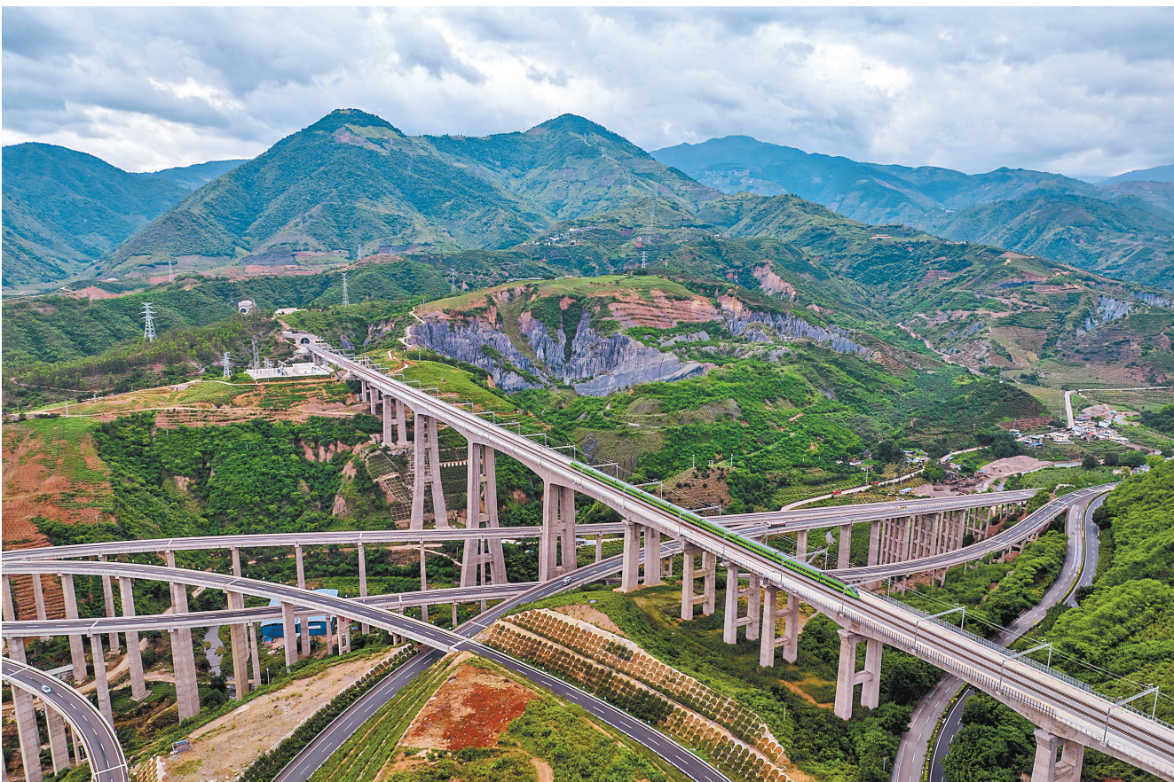
复兴号列车通过中老铁路南溪河特大桥(无人机照片,6月2日摄)。