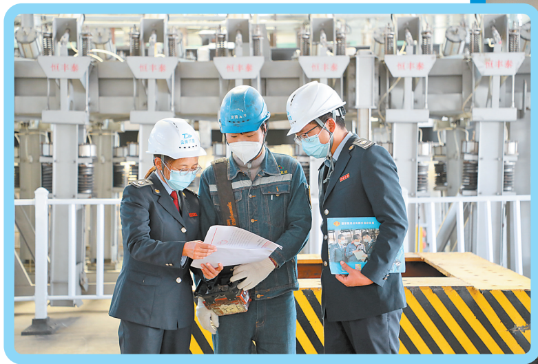
“税务管家”到云南其亚金属有限公司开展退税专访

方面提出了8项政策措施，“真金白银”让市场主体得实惠、添动力，努力保持经济运行在合理区间。