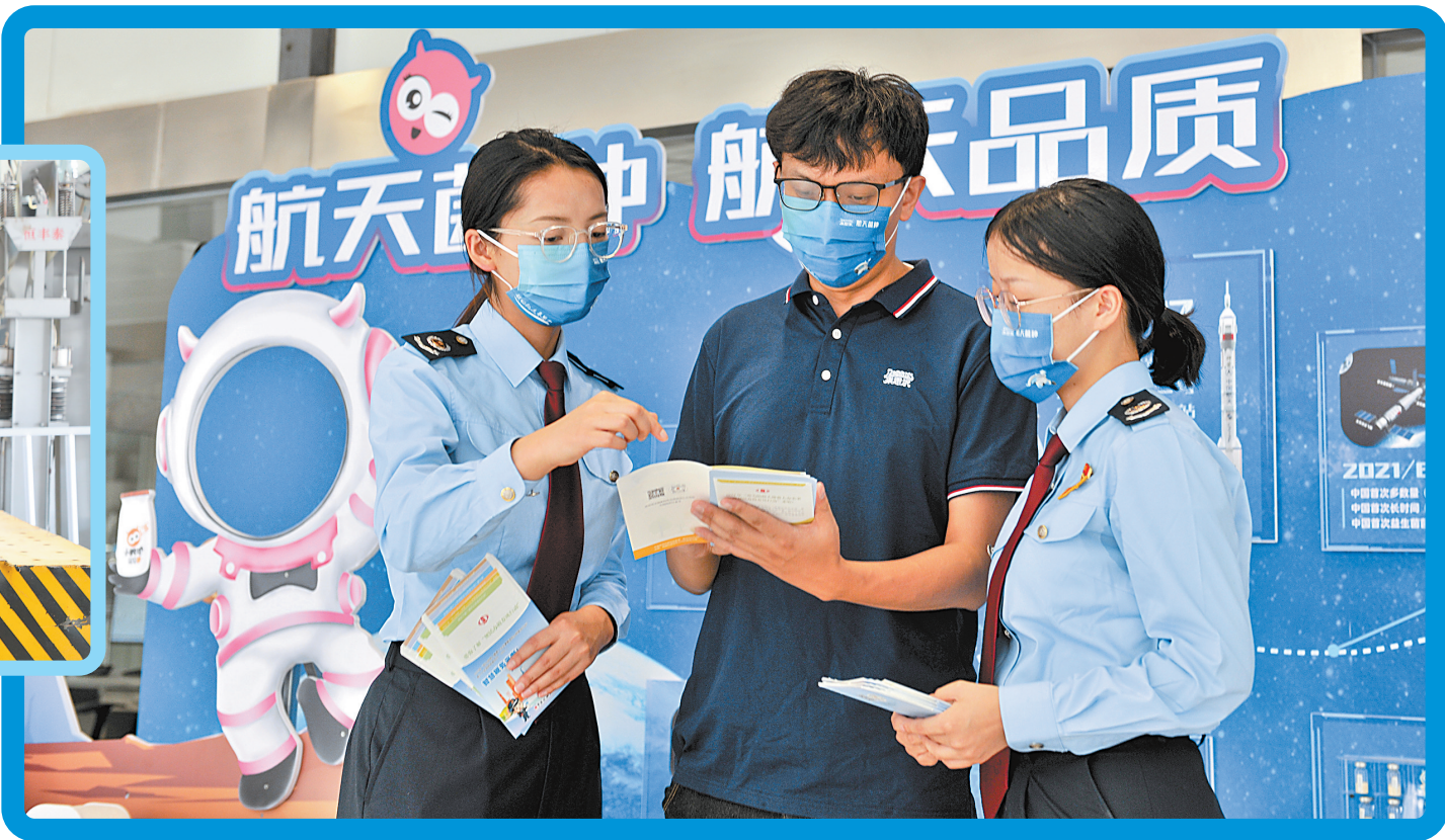
深入云南皇氏来思尔乳业有限公司宣传增值税留抵退税政策