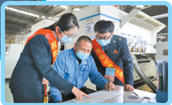
税务工作人员走进生产车间开展“滴灌式”宣传辅导