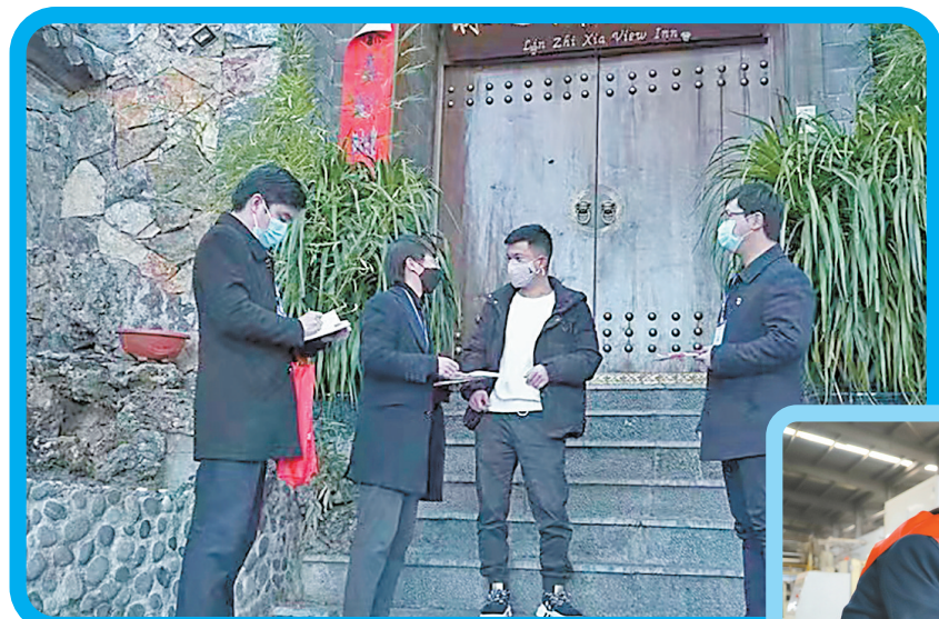
丽江古城农村商业银行深入各小微企业推介信贷产品 供图