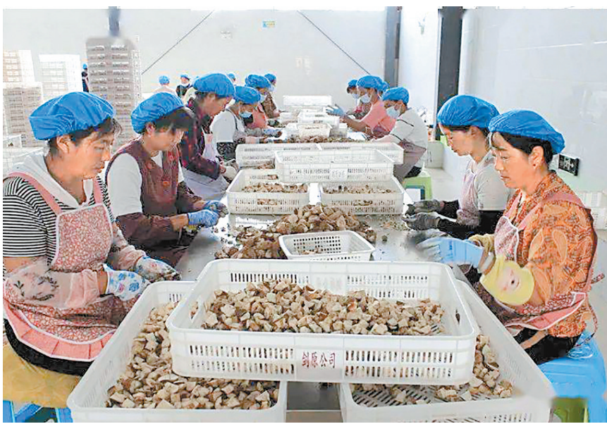
剑原农副产品有限公司野生菌加工车间

受外部形势和新冠肺炎疫情冲击等因素叠加影响,国内外环境复杂性、不确定性明显增加,云南省中小微企业面临成本增高、订单减少、资金紧张、人流物流不畅、难以正常生产经营等问题。漾濞彝族自治县的一家主营再生纸、纸制品生产销售的小微企业就遇到这样的问题。了解到具体情况后,兴业银行昆明分行立即召开专题研究会,充分协调授信政策支持并给予利率优惠,于2020年为该企业发放贷款1000万余元,助其生产和业务发展重回正轨。2021年8月,在这笔贷款到期前,兴业银行昆明分行了解到该企业因为疫情和“5·21”漾濞地震的影响,依然存在资金困难,便及时向该企业发放1000万元的“连连贷”流动资金贷款,实现了企业的无还本续贷,从根本上解决了该企业贷款到期资金周转难题。