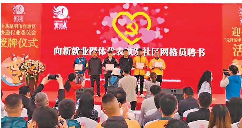
官渡区向新就业群体代表颁发社区网格员证书

上一堂特别的微党课,看一场精彩的情景小剧,聆听身边的感人故事,收获组织的爱心礼包……在“七一”建党节来临之际,昆明市官渡区举行快递行业党委授牌暨迎七一“先锋骑手·党心暖我心”活动,让快递小哥这群城市“摆渡人”有了砥砺前行“定盘星”,感受到别样的温暖和幸福。