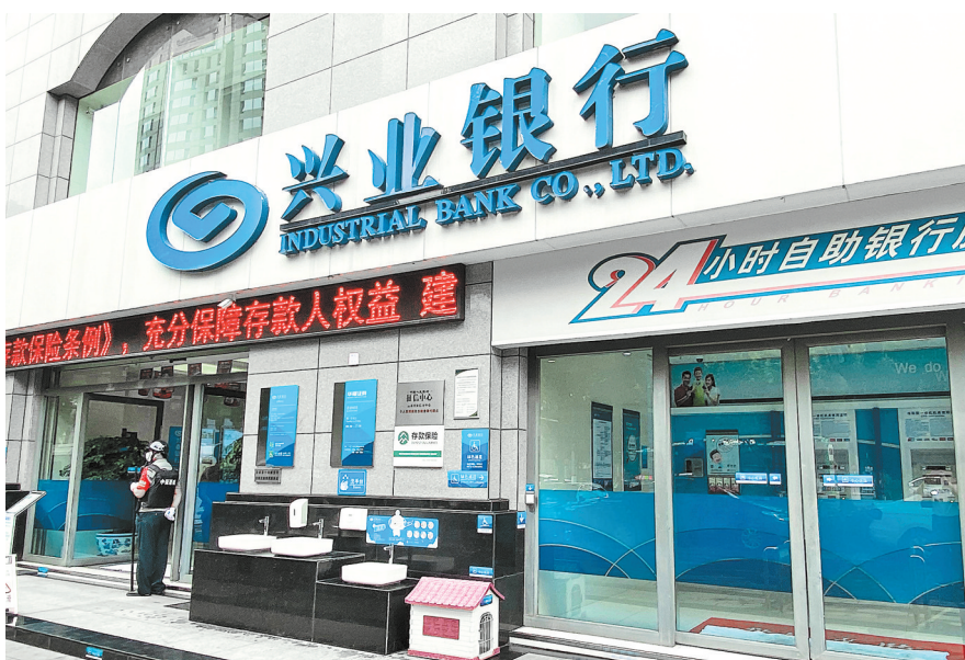
兴业银行昆明分行

务效率,从不同场景、不同角度满足中小微企业融资需求,最大限度帮扶中小微企业,助力云南省中小微企业保存量、扩增量、提质量,为云南经济社会高质量跨越式发展贡献力量。