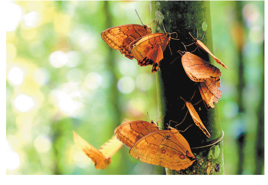
中国·红河蝴蝶谷 中国·红河蝴蝶谷位于红河州金平县境内,谷内蝴蝶种类有400余种,是世界上蝴蝶资源最为丰富的地区之一。每年5月下旬开始,数以亿计的箭环蝶在此呈爆发状破茧成蝶,形成罕见的蝴蝶集中羽化生物活动景观。