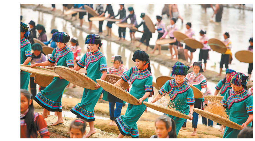
哈尼梯田 红河哈尼梯田位于红河州南部,遍布于元阳、红河、金平、绿春4县,总面积约100万亩,是哈尼族等世居民族1300多年来生生不息“雕刻”的山水田园风光画。2013年,红河哈尼梯田被列入世界遗产名录,成为中国第45处世界遗产。