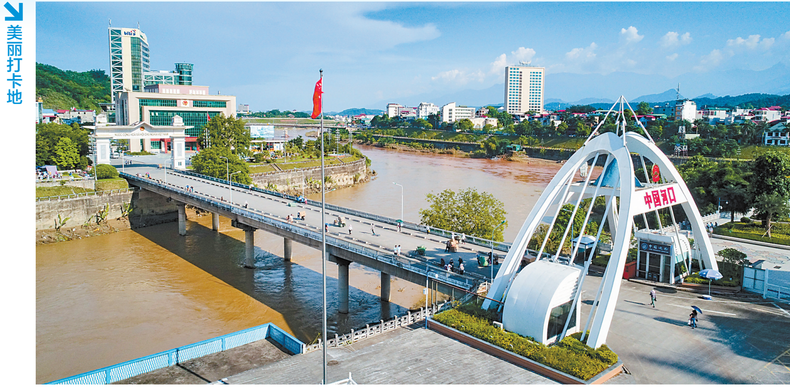
中国河口口岸 河口口岸位于红河州河口县,与越南老街市隔河相望,是中国西南通向中南半岛的重要陆运口岸,也是中越边境云南段最大的口岸,包括河口(铁路)口岸和河口(公路)口岸。特殊的地缘环境让河口县形成了“城市即口岸、口岸即城市”的独特景观。

红河是一条河流,它发源于云南大理白族自治州巍山彝族回族自治县,经大理、楚雄、玉溪、红河及越南北方17个省注入北部湾,全长1280公里。 红河也是红河哈尼族彝族自治州的简称,它也代表着近450万哈尼、彝、汉、苗、瑶、傣、回、壮、拉祜、布朗等10个世居民族和其他各族人民,代表着13个县市、3.29万平方公里国土面积、848公里国境线,以及美轮美奂的哈尼梯田、沧桑百年的滇越铁路…… 我在这片土地生活、工作近一个甲子,见证了半个多世纪波澜壮阔的发展历程。 我的老家在红河州元阳县一个叫热水塘的偏僻小山村。以前的县城就在对面的山顶上,我们在地里干活时,可以隐约听到县城喇叭的声响。声音可以径直地飘过来,不需要拐弯抹角,不需要跋山涉水。我们每次去县城,却是单边必走5到6个小时的。我在那里读书时,周六回家、周日返校,每次都走得我双腿肿胀、脑袋昏沉、耳朵嗡嗡叫,一到目的地就像一只泄气的皮球瘫坐在地上,再也不想动弹。很长很长时间里,我每一次回老家,都是心理和生理的极大考验。 脱贫攻坚的最后一年,我大伯家的土房拆除了,国家帮助建了一栋钢筋水泥房。这是我们村最后一间土房,也是由我父亲建造的最后一间土房。我父亲是木匠,曾在村里和邻近的寨子中建起无数土房,如今那些土房已经全部消失,代之而起的是钢筋水泥房。从房子的更新换代,可见一个时代已然远去,新的时代已经到来。 2018年至2020年,我有幸在红河州金平苗族瑶族傣族自治县某村参加驻村扶贫工作队,见证了国家在该村投入数百万元民房建设资金和数百万元乡村公路建设资金,顺利实现整村脱贫。 也是在驻村扶贫期间,我完成了一部叙事长诗《醒来的西隆山》。“直过民族”拉祜族中部分苦聪人,世代代居住在位于中越边境的西隆山深山老林,没有盐巴,没有衣物,没有铁具,过着钻木取火、采摘树叶和野果充饥、不断被猛兽侵袭的生活。新中国成立之初,解放军战士奉命进入西隆山寻找界碑,在西隆山上遭遇“野人”,从而发现了苦聪人。解放军民族工作队和地方政府苦聪人访问团共同展开了寻找苦聪人、帮助他们定居农耕和发展生产的工作。在党和政府,以及当地各族人民的帮助下,经过60多年的努力,苦聪人整体脱离贫困步入小康,生产生活水平与当地其他民族相当,融入到了温暖祥和的祖国大家庭。 长诗通过对拉祜族苦聪人李干斗、女巫莫奔、老族长、猎手及解放军战士、苦聪人访问团团长、汉族老师、省州县等各级党组织书记、扶贫干部等人物的塑造,反映苦聪人的艰难历史和新中国成立以来的发展历程,表现党和国家民族工作的丰硕成果和民族政策的伟大胜利,讴歌改革开放、脱贫攻坚和民族团结,颂扬70余年来边疆民族地区经济和社会各项事业建设的辉煌成就。 苦聪人是一个点,由点及面,可见红河州经济社会的发展确实令人欣喜。 现在我非但不怕回老家了,而且乐于频繁回老家。我觉得没有一个地方像老家一样承载了自己整个童年的记忆,没有一个地方是我老老少少都认识,没有一个地方有我的梯田——除了老家!几年前我在老家盖了自己的房子,工作不忙的时候,一个月回去两三次。老家的梯田美名传千里,整个山坡娇美明媚,来这里旅游的人络绎不绝。老家生活水平的提高是三四十年前的我们无法想象的,我常常被邀去村里不同人家做客,每一家都是鱼肉满盆,加上山上的各种野菜和梯田红米,饭菜特别可口。现在的偏远山村也村村通公路,村村的公路都是硬化了的。从蒙自到热水塘,公路里程110公里,开车用时2小时30分以内,高速公路离我老家也就20公里。 随着经济的发展和交通条件的改善,“偏远”“偏僻”“贫穷”“落后”这样的词语终将从我们的字典里消失。