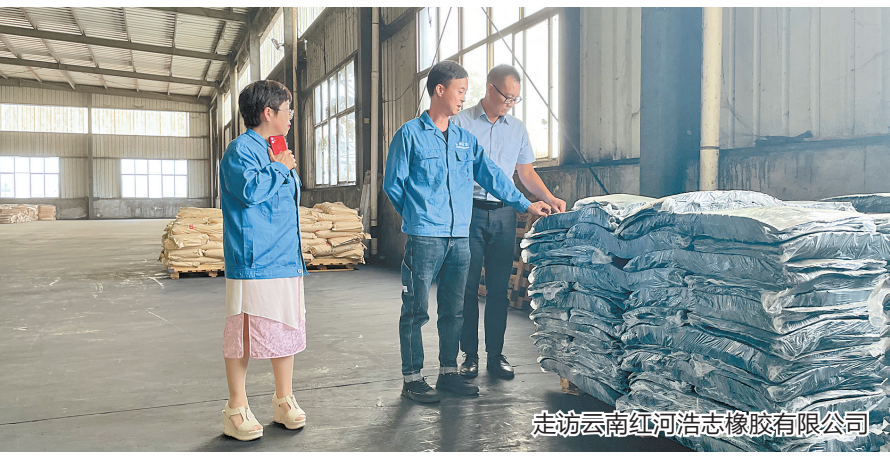
走访云南红河浩志橡胶有限公司

为稳住经济大盘,积极响应党中央、国务院的决策部署,邮储银行云南省分行出台了一系列助力经济稳增长的措施。以推动信贷“稳增长”为抓手,及时优化信贷资源,着力于支持重点领域和薄弱环节,促进小微企业融资增量、扩面、降价,以实际行动支持实体经济纾困发展。