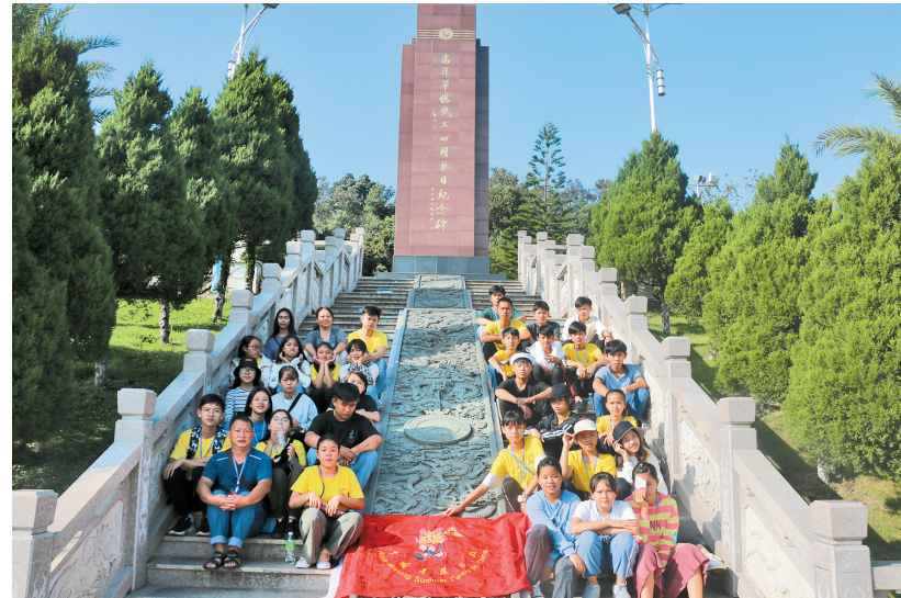
中国寻根之旅夏令营

为侨服务是侨联的基本职责,也是侨联工作的重中之重。2017年,“法治宣传边关行”首次在德宏傣族景颇族自治州姐告口岸举办。近年来,通过大型广场宣传活动、送法下乡活动等方式,全省侨联累计培训边民及周边国家政府