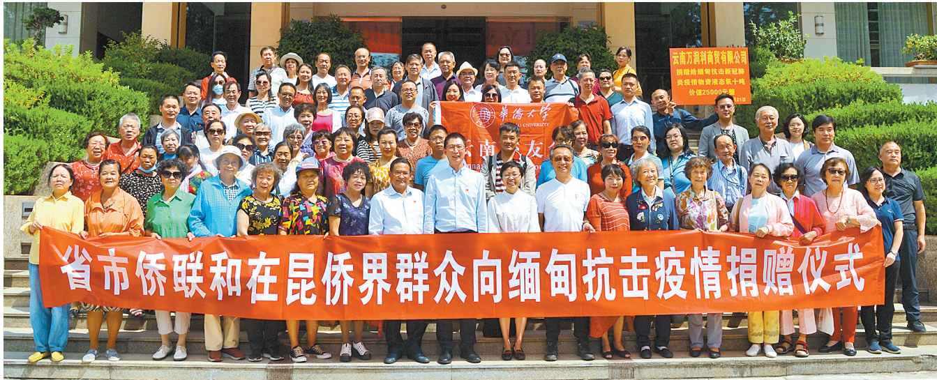
省侨联组织在昆侨界人士向缅甸捐赠抗疫款物

云南是全国第五大侨乡省。多年来,广大海外侨胞情系桑梓,积极支持家乡发展建设,成为推动云南改革开放