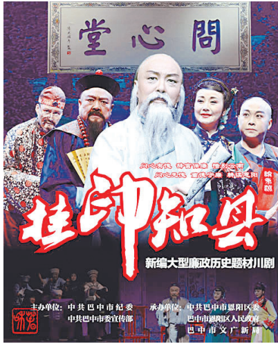
川剧《挂印知县》剧照

到百姓信任,“喻青天”美名逐渐传开。此后,喻秉渊养成了一个习惯,每次审案之后回到书房,总要反复思索案情经过,扪心自问断案是否公允,是否做到上不愧于朝廷,下不愧于黎庶。同治皇帝为褒奖他,赐以“问心堂”匾额。喻秉渊将这块匾视为至高无上的荣誉,十分珍惜。由于喻秉渊为官清正廉洁,政声卓著,百姓拥戴,朝廷还赐予“永锡尔极”匾额,褒奖其仁孝之行。