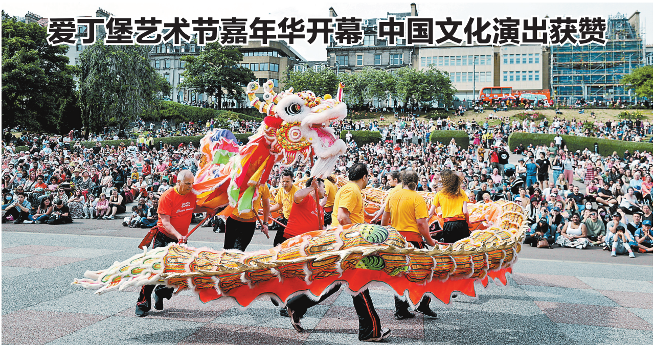
爱丁堡艺术节嘉年华活动7月17日在英国苏格兰首府爱丁堡市中心举行，来自数十个国家和地区的800余名演员带来各具特色的表演，300多名华侨华人组成当日最大方阵，献上丰富多彩的中国文化演出，获得观众热烈掌声。图为当地民众观看舞龙表演。