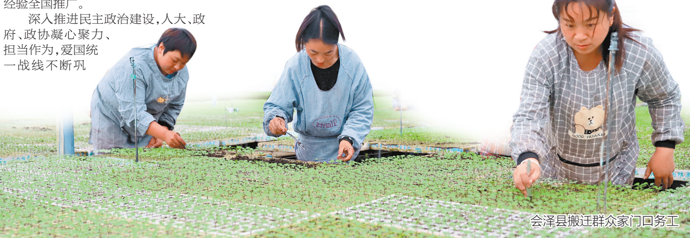
会泽县搬迁群众家门口务工

我们将全面落实曲靖市委、市政府沾益区现场办公会议精神，大力实施奋进新征程推动新跨越三年行动，加快打造先进制造基地、城乡融合示范区、珠江源生态环境示范区，推动沾益经济社会高质量发展实现新突破，奋力谱写沾益全面建设社会主义现代化新篇章。 ——沾益区委书记段庆东 本报记者 张雯 整理