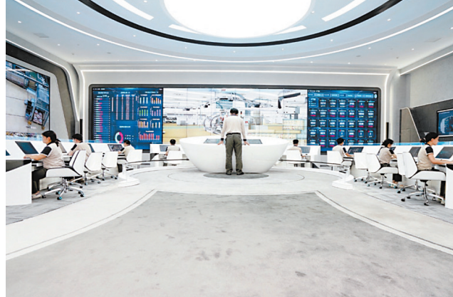
昆明卷烟厂数控中心建成使用