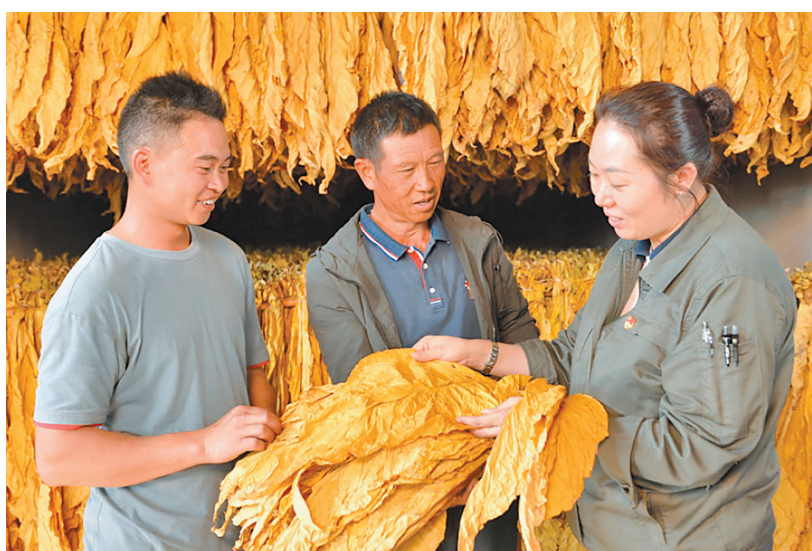
红云红河集团连续6年坚持开展基地烟叶质量品牌符合性评价