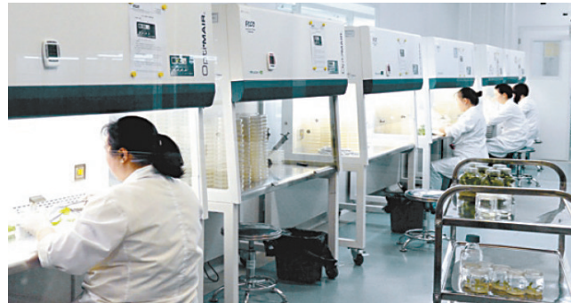
云南中烟育种工厂