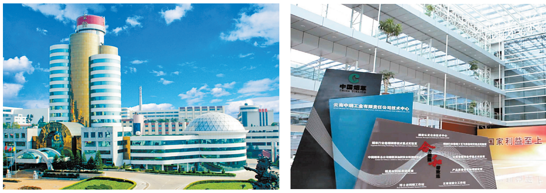
云南中烟营销中心挂牌成立