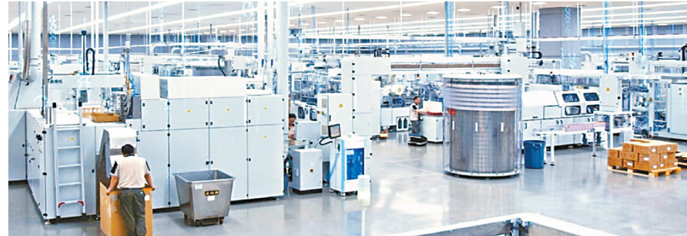
红河卷烟厂新厂落成投产