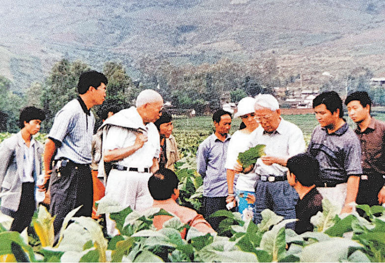
工厂把“第一车间”办到烟田