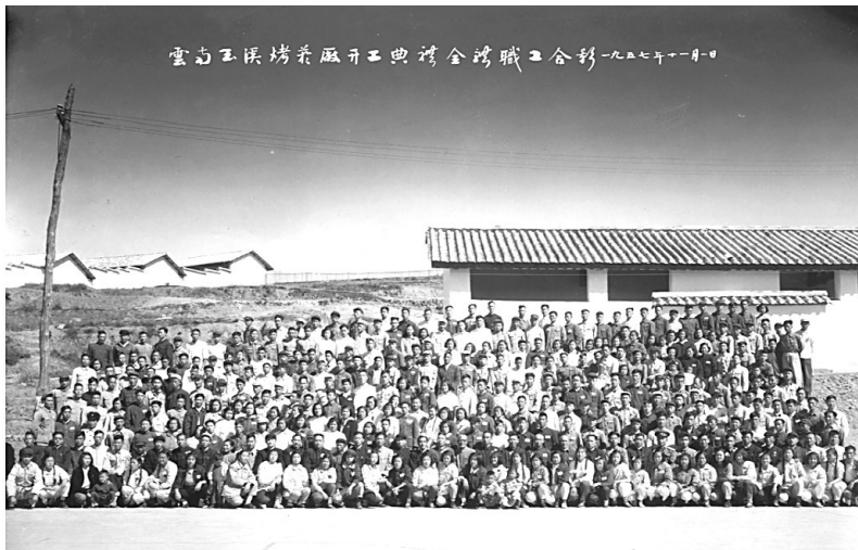
玉溪烤烟厂开工典礼