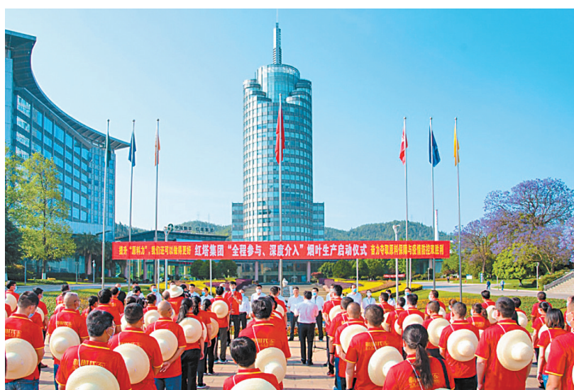
红塔集团从2020年开始每年抽调精兵强将编入烟叶生产联合下乡工作组