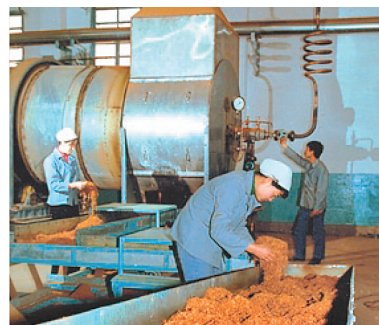
引进中国第一条狄更生制丝生产线