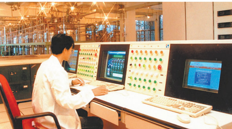
全国第一条全自动集中配料生产线中央控制室