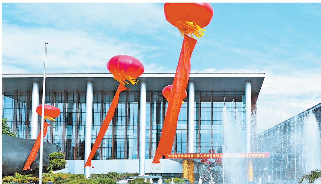
改制成为“云南中烟工业有限责任公司”

工商分开，推动联合重组，卷烟上水平，精益管理做法，提税顺价……中国烟草从“黄金十年”“走进思考实践”三大课题”时期，云南卷烟工业从“九变四、四变三、三变二”到“两统一、两整合”的改革，正是行业深化改革大河奔流的生动写照。