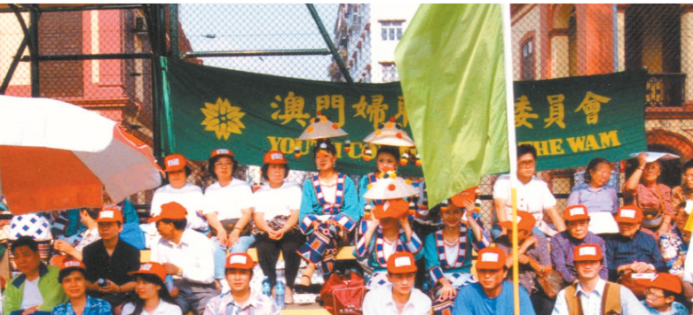
云南卷烟进入澳门有税市场