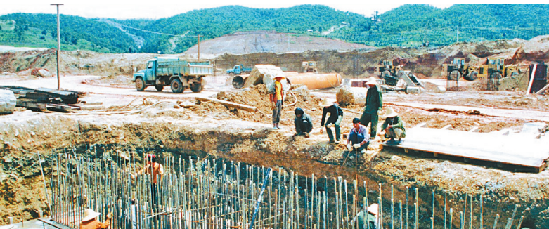
关索坝易地搬迁改造工程

变革总是悄然而至。随着改革开放红利释放，生产力快速发展，卷烟市场由短缺向过剩、由卖方市场向买方市场转变，云南卷烟产品不再是“皇帝的女儿不愁嫁”。站在十字路口上，云南卷烟工业实事求是，尊重市场规律，在自我否定中走出困境。