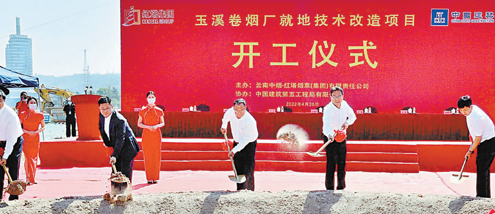
玉溪卷烟厂就地技术改造项目开工仪式