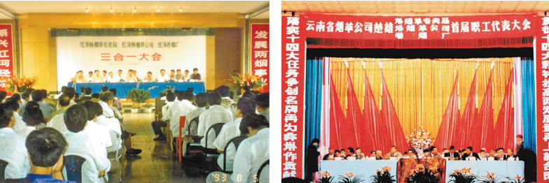
烟草专卖局、烟草公司、卷烟工厂实行“三合一”体制改革