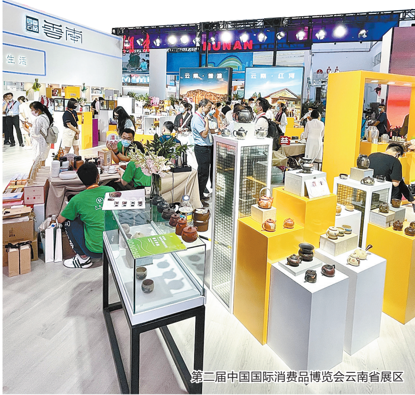
第二届中国国际消费品博览会云南省展区