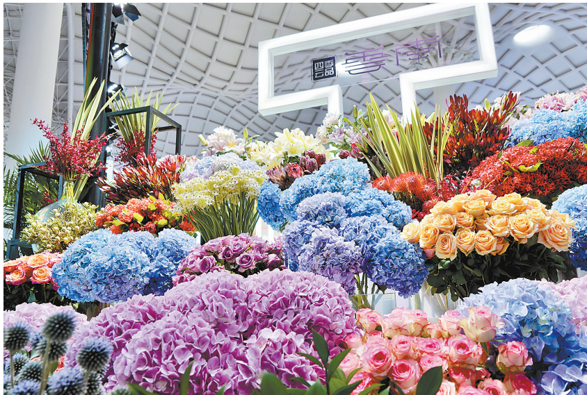
第二届中国国际消费品博览会云南省展区鲜花展品

盛夏的海南,碧海蓝天,空气仿佛都是炽热的。7月25日至30日,第二届中国国际消费品博览会(简称消博会)在海南省海口市举办,会场内随处可以感受到来自消费、合作的热度。