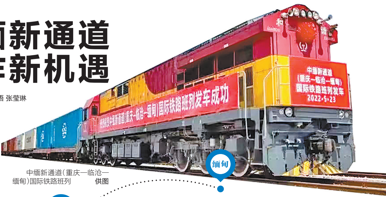
中缅新通道(重庆—临沧—缅甸)国际铁路班列