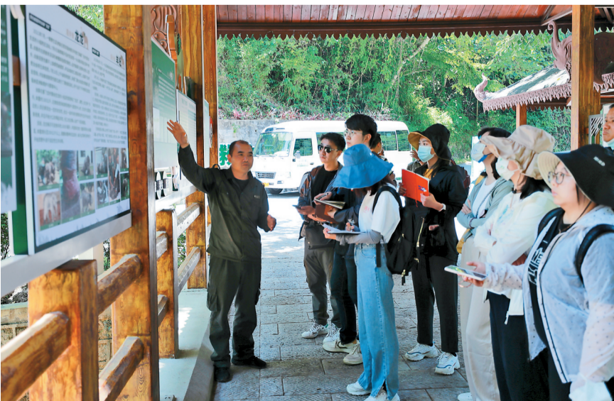
在亚洲象繁育中心，“象爸爸”讲述他们救助小象的故事。

7月中旬,一群多达34头的野生亚洲象走出西双版纳国家级自然保护区的尚勇自然保护区森林,在村寨附近山坡上悠闲觅食的场景再度引起关注。随着保护力度的加大和自然生态环境的持续向好,保护区实际面积从原来的360万亩增加到622.8万亩,全州71%以上乡镇均有野生亚洲象活动的西双版纳,已成为一个人象和谐共处的幸福家园。