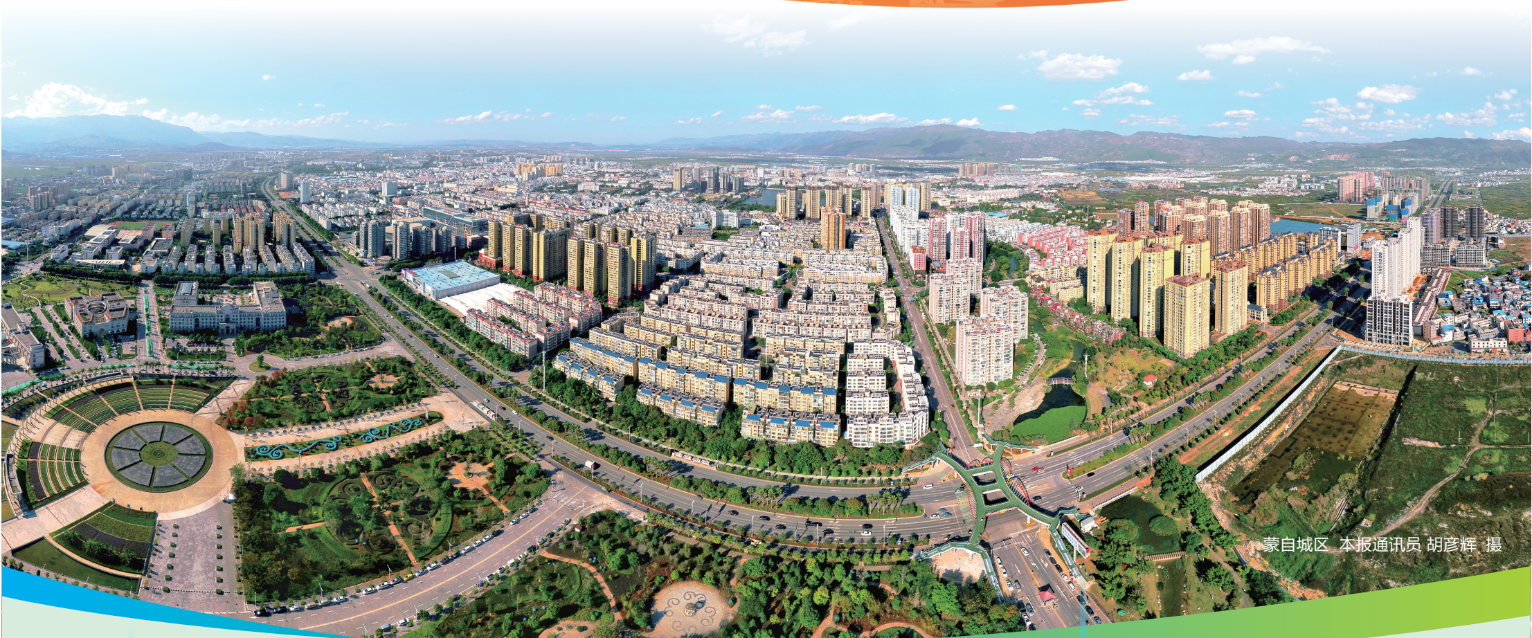
蒙自城区