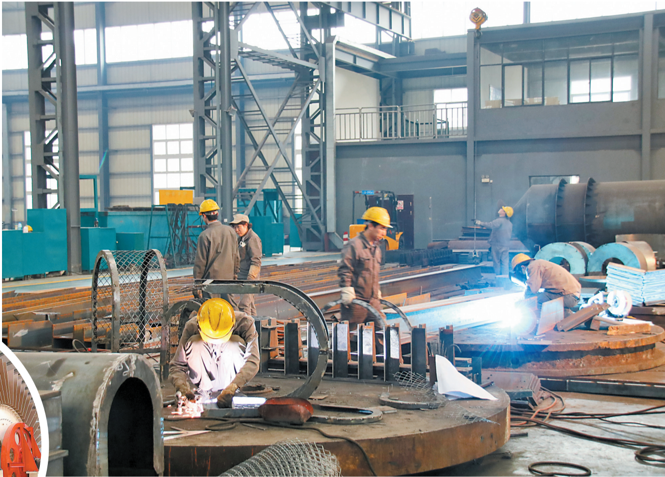
云南迦南飞奇科技有限公司生产车间

这也是昆明市委、市政府制定出台三个文件以来的首个落地项目。对此,昆明市相关部门负责人表示,禄劝县、富民县和新希望集团此次的跨区域合作,将