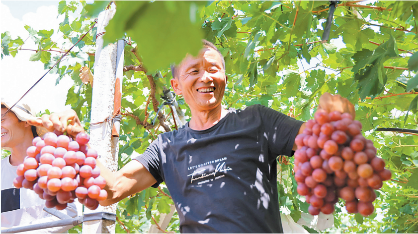
宾川县鸡足山镇新川村雁梅家庭农场

“十四五”期间，宾川县将突出“两果”优势，全面提升全县水果产业品牌化、组织化、规模化水平。以打造“绿色食品品牌”为引领，稳步推进葡萄品种改良中心建设，建设1个10万亩葡萄走廊和5个万亩、20个千亩、100个百亩特色农产品基地。到2026年，早熟鲜食葡萄、晚熟柑桔等特色水果种植规模达42万亩，力争实现农业总产值222亿元，基本建成世界一流水果之乡。