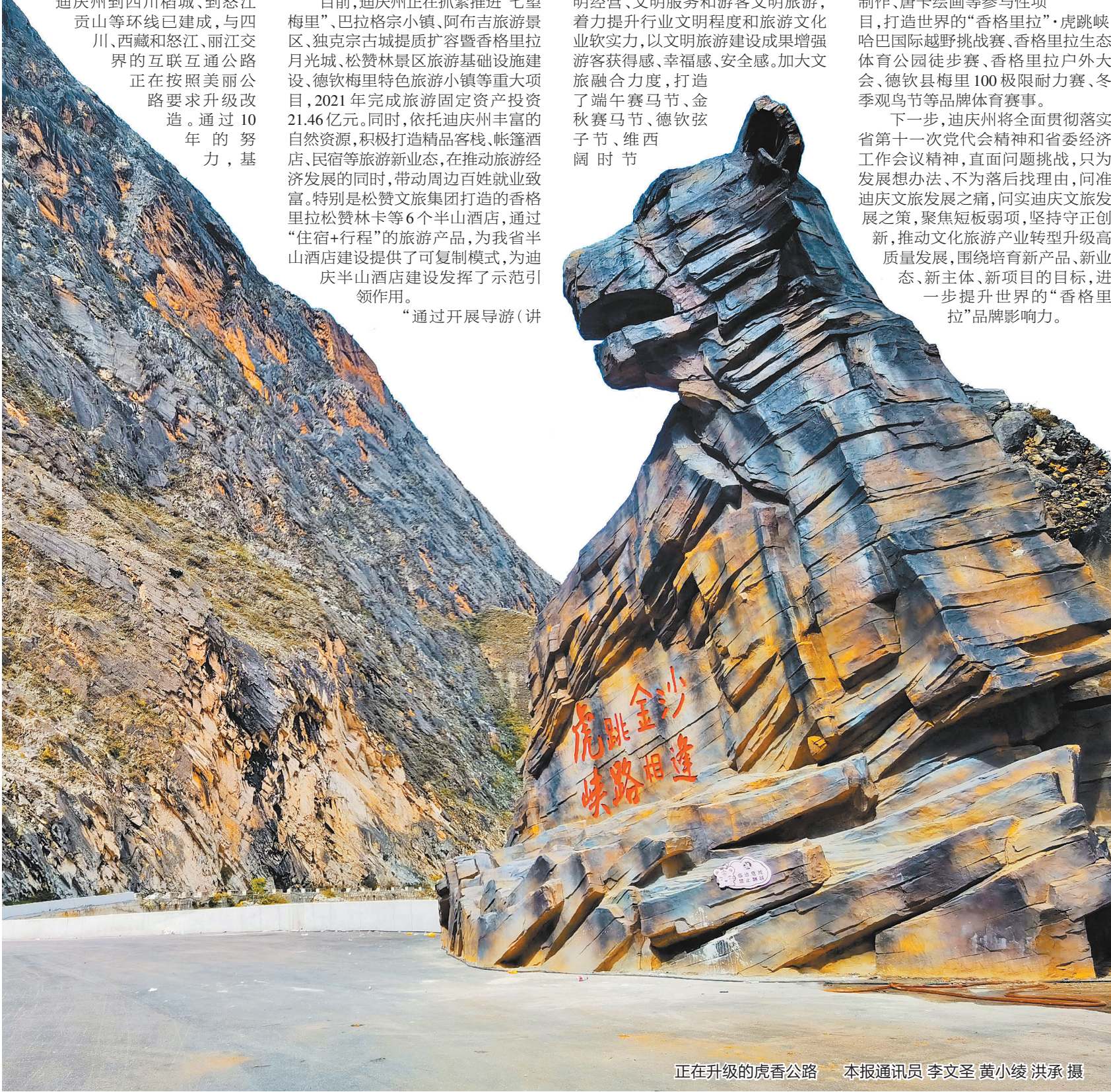
正在升级的虎香公路