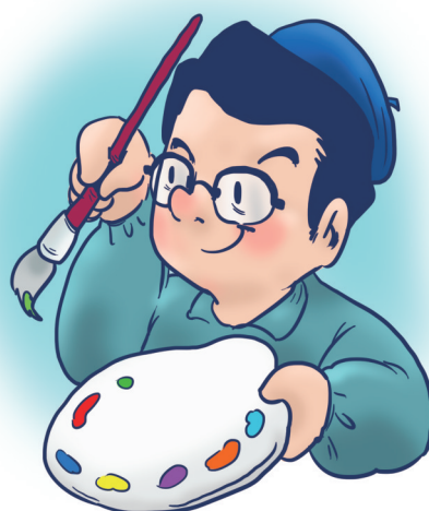
本报美编 张维麟 画