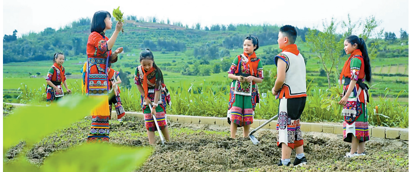
学生参与田间管理

秋风送爽，弥勒市西三镇风光旖旎。集镇日益完备的基础设施，景区川流不息的游人车辆，密布其间的农家乐烟火渐浓，正在创业的村民脸上洋溢着浓浓笑意……近年来，西三镇依托得天独厚的区位优势、生态、旅游资源，以党建引领推进产业强镇、旅游活镇、生态靓镇、依法治镇，一幅幅各具其美、美美与共的乡村振兴图景正变为现实。