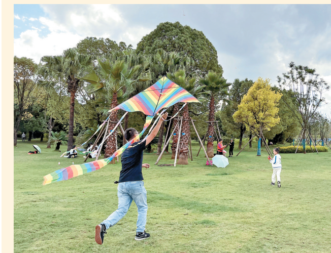
▲ 国庆假日，昆明市民走出家门，来到滇池边、公园内扎帐篷、放风筝，享受自然、放松身心。

强化边境管控，全力投入疫情防控。边境州市公安机关充分依托党政军警民合力强边固防工作机制，落实落细“五个管住”要求，严厉打击跨境违法犯罪，全力封堵境外疫情输入漏洞。全省公安机关严格落实疫情防控各项措施，特别是昆明、西双版纳等地公安机关闻令而动，全力战疫情、保平安，有力维护人民群众生命财产安全。