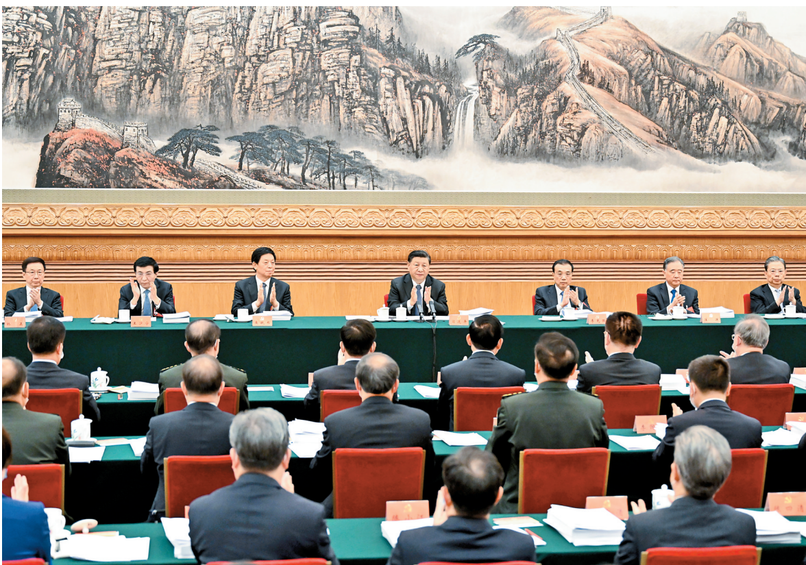
10月18日,中国共产党第二十次全国代表大会主席团在北京人民大会堂举行第二次会议。习近平、李克强、栗战书、汪洋、王沪宁、赵乐际、韩正等出席会议。