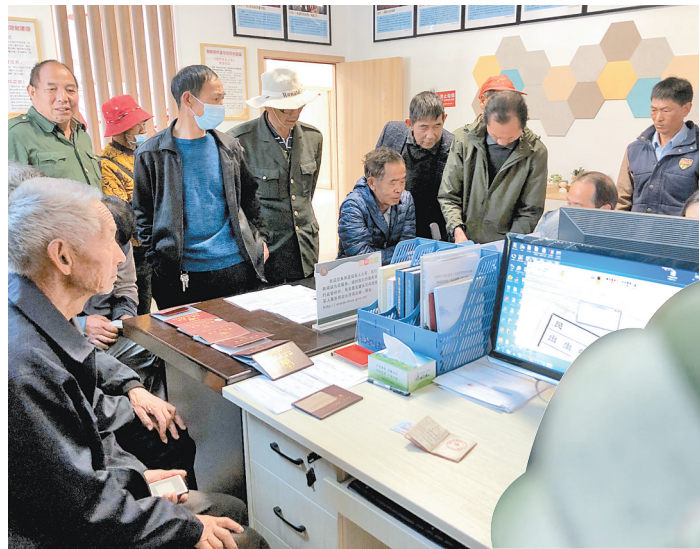
江川区九溪镇退役军人服务站办理优待证