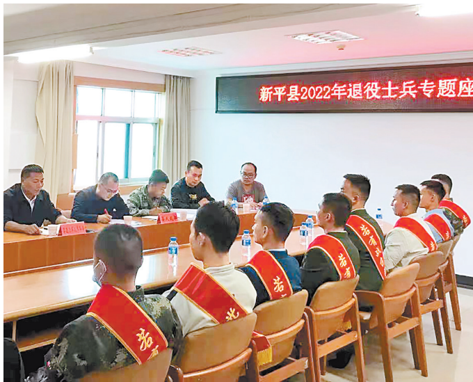
新平县召开退役士兵专题座谈会

役军人及其他优抚对象的合法权益得到有效保障。2022年9月24日,全省退役军人服务保障体系建设现场推进会在玉溪召开,玉溪市退役军人服务保障体系建设经验在全省推广。