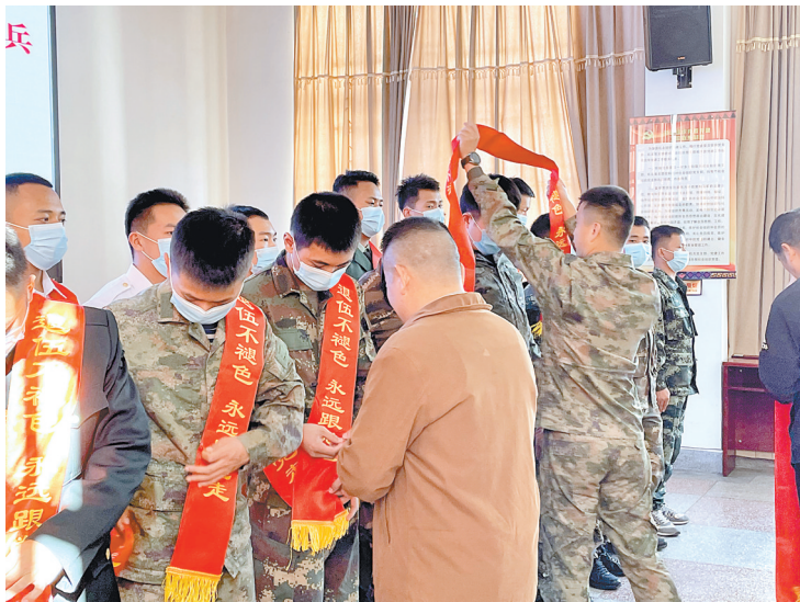
峨山县开展退役士兵返乡系列活动