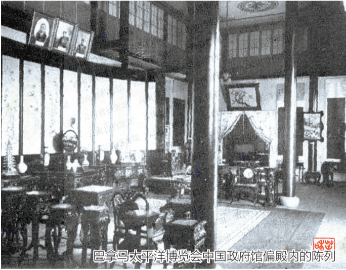
巴拿马太平洋博览会中国政府馆偏殿内的陈列