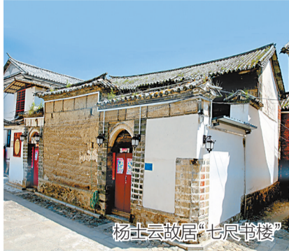
杨士云故居“七尺书楼”

杨士云,字从龙,号弘山,生于1477年,卒于1554年,享年78岁,大理喜洲大界巷人,明代进士,被正德皇帝钦点为“翰林院士”,以给事中致仕。大理市喜洲镇四方街有一座“翰林坊”,上有“赐进士第”“理学名臣”等匾额题字,是对杨士云的褒奖。