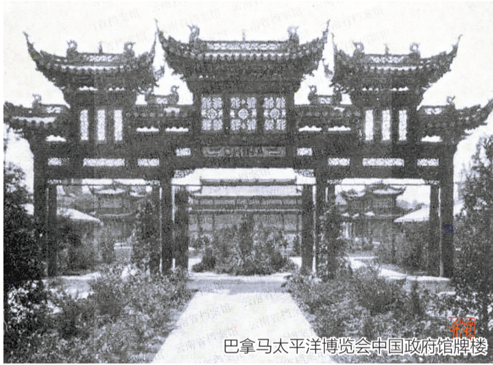
巴拿马太平洋博览会中国政府馆牌楼