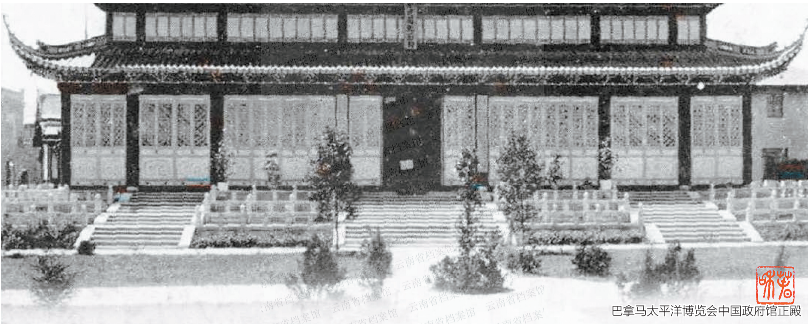
巴拿马太平洋博览会中国政府馆正殿

1911年2月,为庆祝巴拿马运河即将通航,同时也为纪念欧洲探险家发现太平洋400周年,美国国会公决并宣布将于1915年2月20日至12月4日在美国西海岸的加利福尼亚州旧金山市举办国际性的大型博览会——“巴拿马太平洋博览会”。1912年2月,时任美国总统塔夫特批准这一公决,并邀请世界各国政府和人民参加盛会。