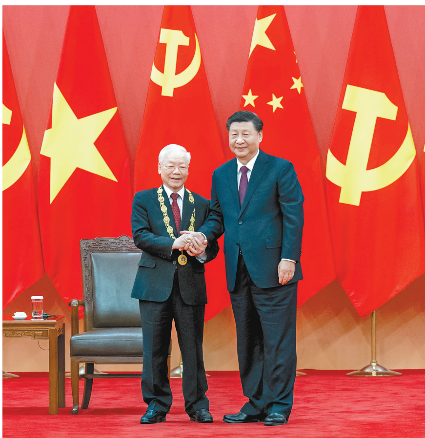
10月31日，中共中央总书记、国家主席习近平在北京人民大会堂向越共中央总书记阮富仲授予中华人民共和国“友谊勋章”，并举行隆重颁授仪式。