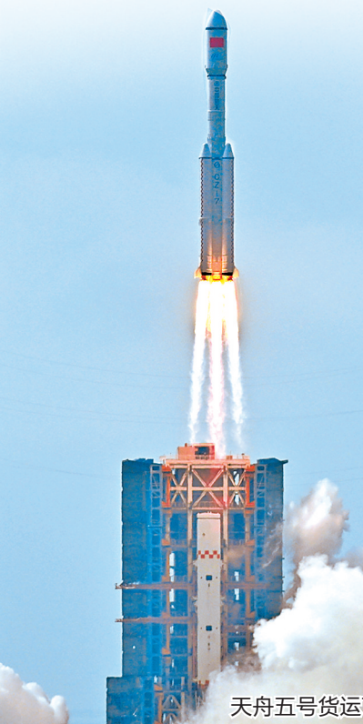
天舟五号货运飞船发射