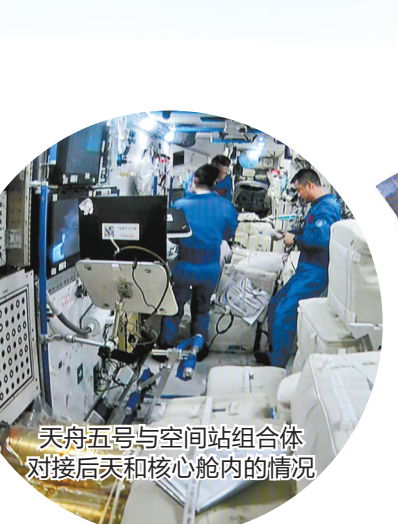
天舟五号与空间站组合体对接后天和核心舱内的情况