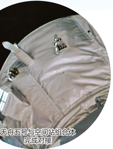
天舟五号与空间站组合体完成对接