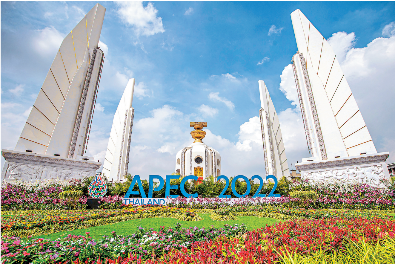
亚太经合组织第二十九次领导人非正式会议将于11月18日至19日在泰国曼谷举行。图为11月16日在泰国首都曼谷街头拍摄的2022年亚太经合组织会议标识。

泰国海上丝绸之路孔子学院泰方院长张楚雄说，他对习近平主席此次充满期待，“泰国人民钦佩中国近年来在各领域的快速发展，热烈欢迎习近平主