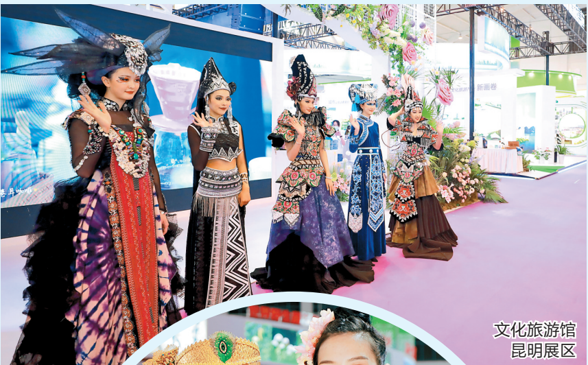
文化旅游馆昆明展区