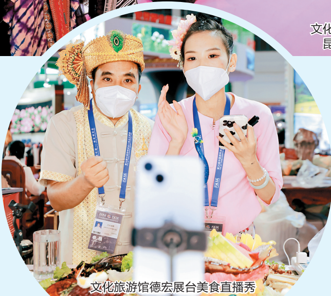
文化旅游馆德宏展台美食直播秀