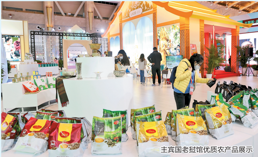
主宾国老挝馆优质农产品展示