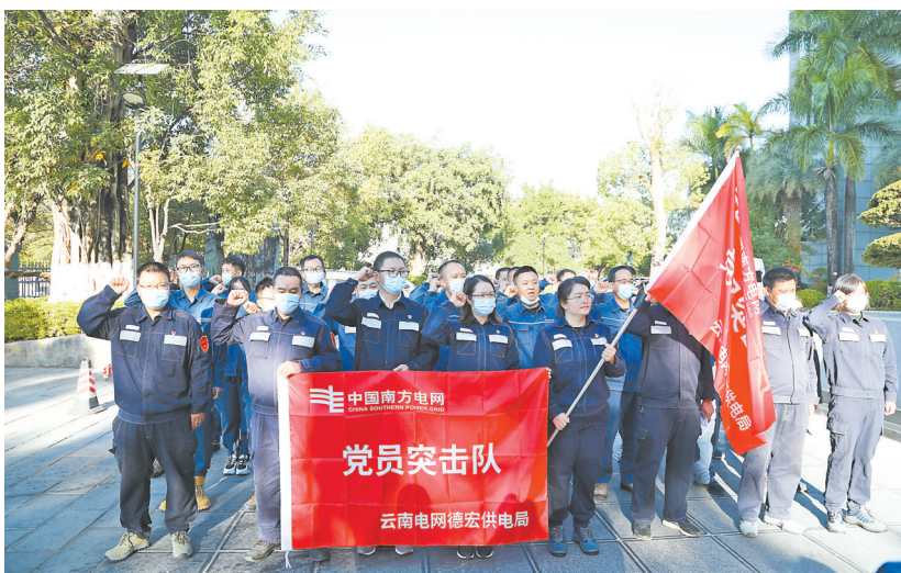
成立党员突击队