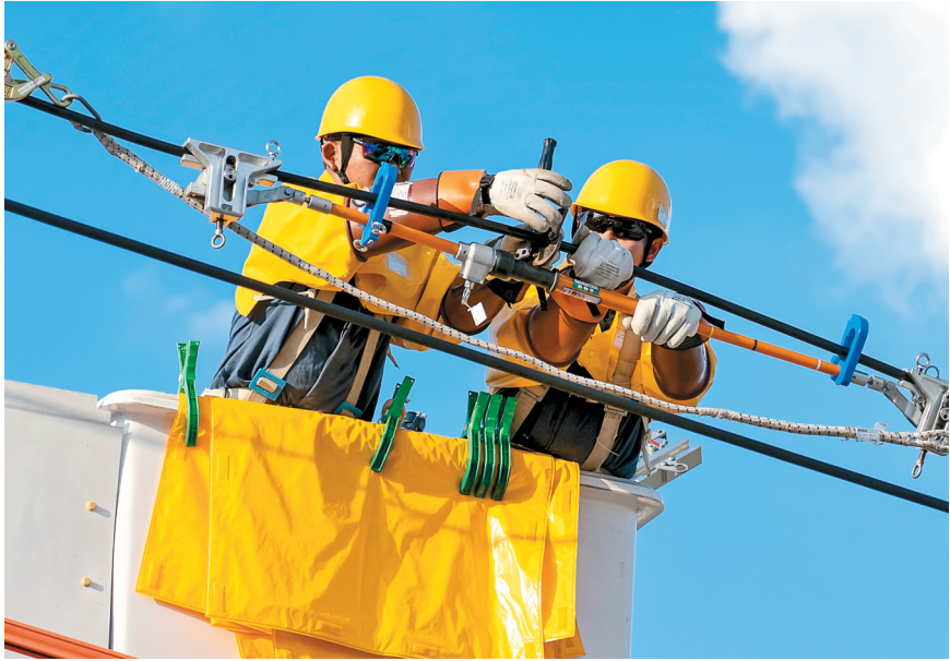
开展带电作业

2016年4月,石梯村村民小组被列为全省30个边境小康示范村之一,不仅是边境线上展现国家形象、守土固边的坚固堡垒,还是独具特色的旅游村寨、观鸟胜地。石梯村保存了犀鸟、红腿小隼、灰孔雀雉等珍稀鸟类以及龙脑香、篦齿苏铁等稀有树种,其中有国家一级保护植物4种、国家二级保护植物22种,国家一级保护动物15种、国家二级保护动物74种,是全国村一级生物多样性最密集的地区之一。如今,石梯村已经成为德宏州学习习近平新时代中国特色社会主义思想基层示范点和盈江县生态保护、民族团结、强边固防的示范点,成了中缅边境线上一道亮丽的风景线。