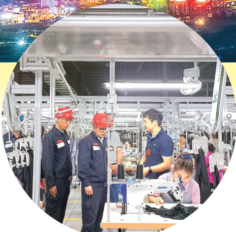
到企业进行用电回访