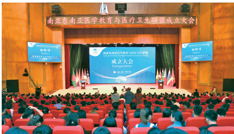
南亚东南亚医学教育与医疗卫生联盟在昆明医科大学成立