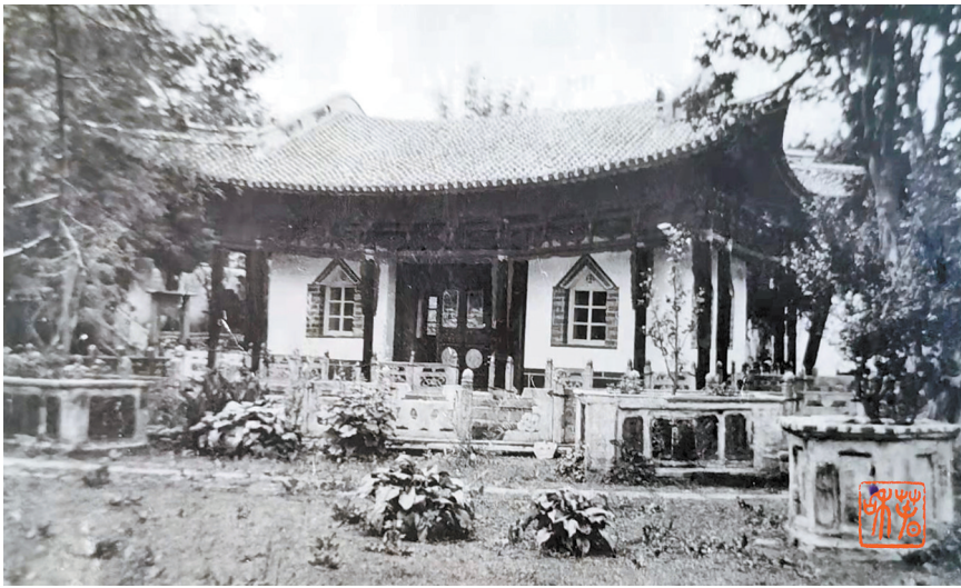
西云书院南花厅柱堂，取蟾宫折桂之意