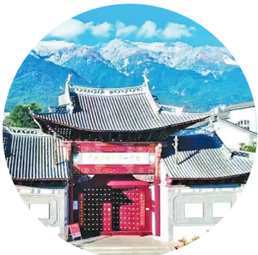
如今的大理第一中学校门

在云南大理古城，坐落着一所百年名校，光绪三年（1877年）建校至今，弦歌不辍。随着历史的滚滚车轮，学校与时俱进，十易其名，不断改进教学内容和育人目标，可谓人才辈出，群星璀璨：有乡试解元、辛亥元老、中国共产主义运动先驱、抗日名将、中共中央委员、两院院士、学界翘楚。从西云书院到大理一中，是近代以来云南教育演变的缩影。