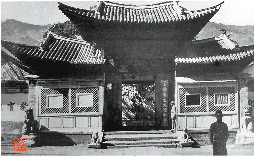
省立大理中学校门