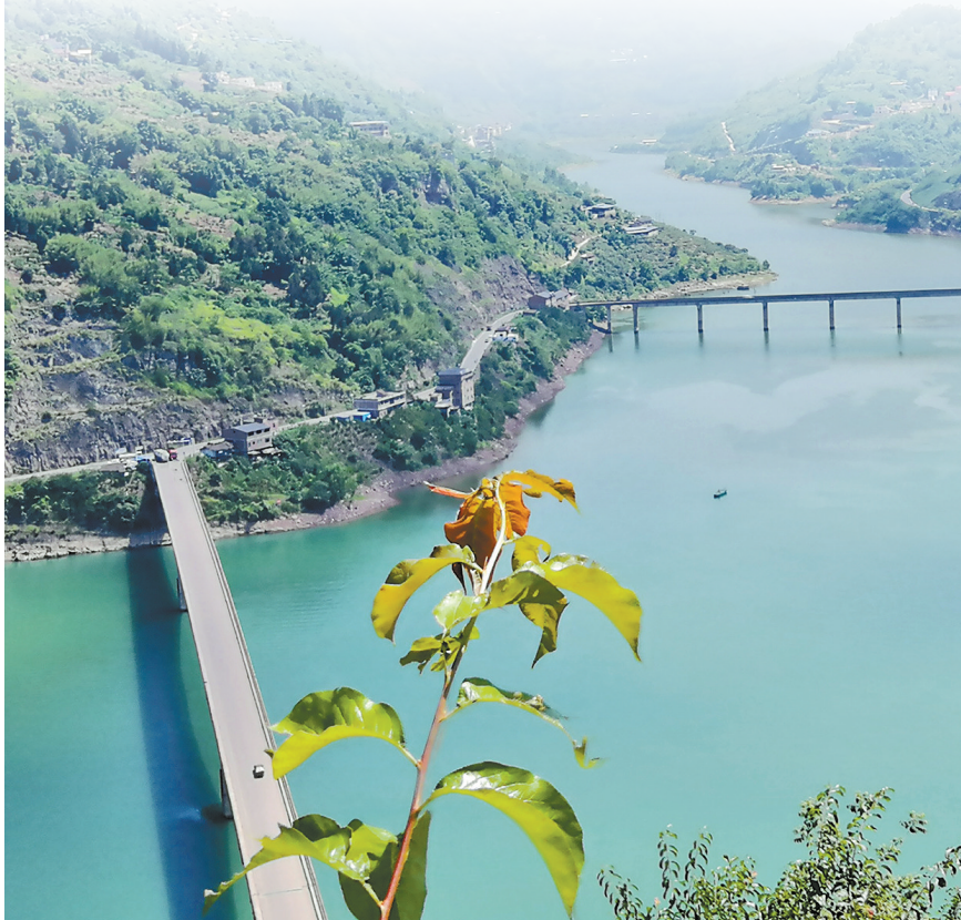
金沙江两岸山清水秀