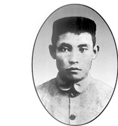
大理一中五英烈：张伯简、王复生、王德三、周保中、施介