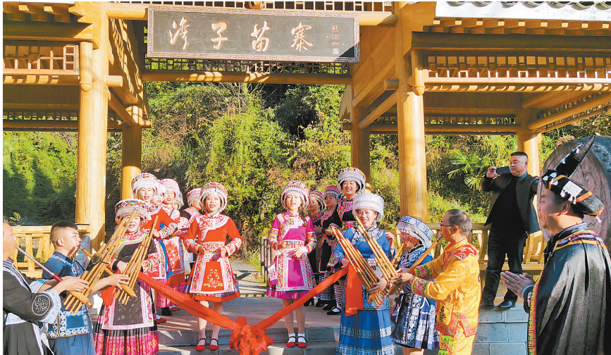
苗族群众在寨子门口迎八方来客

当地村民说让我们顺着红军长征路走下去，就可以看到一个隐藏在云贵川“鸡鸣三省”乌蒙大山里的湾子苗寨。然而，走在这条石板铺成的山道上，我们似乎看不出有一个寨子的迹象，但它确实就在前面。