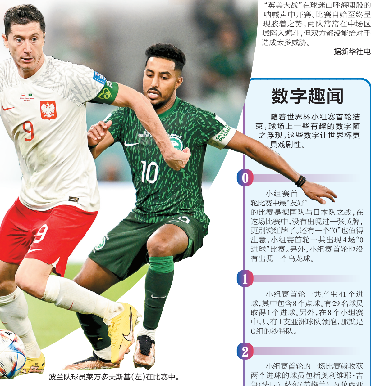
波兰队球员莱万多夫斯基(左)在比赛中。