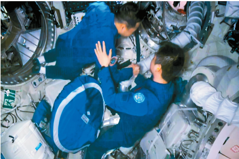
神舟十四号航天员陈冬在天和核心舱气闸舱迎接神舟十五号航天员乘组。

1992年，中国载人航天工程正式立项。30年来，工程从无到有，结下累累硕果，空间站即将完成建设，还具备了开展载人月球探测工程实施条件。但中国载人航天探索的脚步不会只停留在近地轨道，一定会飞得更稳更远。