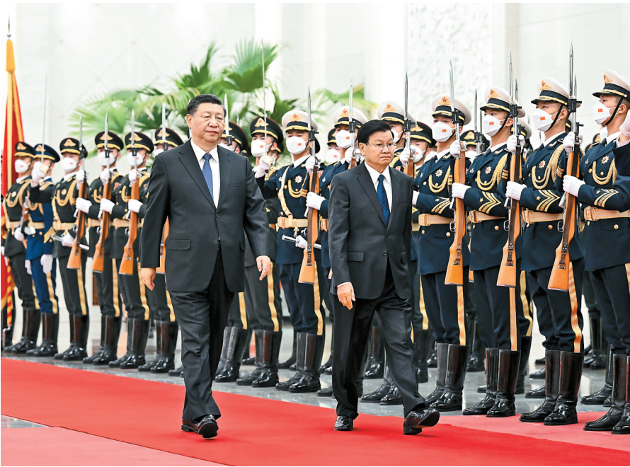
11月30日，中共中央总书记、国家主席习近平在北京人民大会堂同老挝人民革命党中央总书记、国家主席通伦举行会谈。

习近平表示，老挝人民革命党十一大以来，面对复杂多变的国际国内形势，老挝人民革命党中央着力加强自身建设，坚持走符合自身特点的社会主义道路，努力维护政治社会稳定和经济持续发展，同时为维护地区和平稳定、维护发展中国共同利益作出贡献。相信在以通伦总书