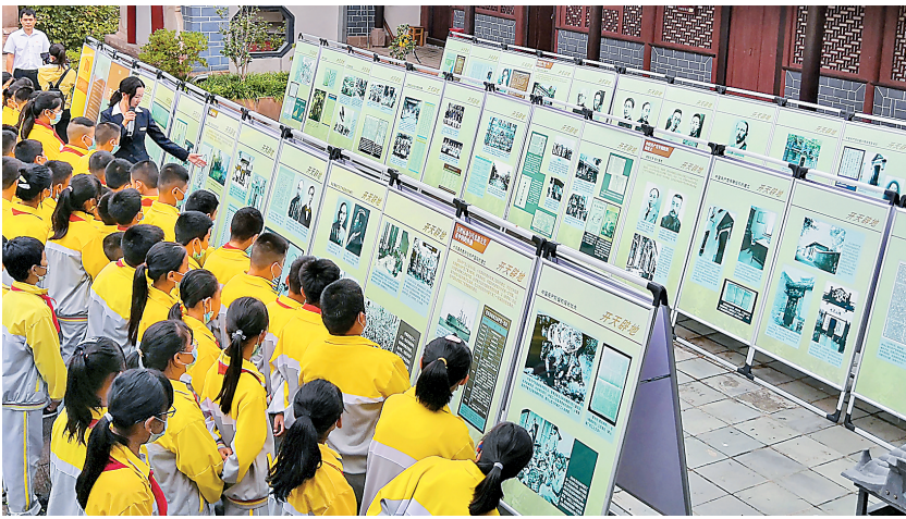
景东县开展社会主义核心价值观教育实践活动。

景东县打出文明创建“组合拳”,全力营造廉洁高效的政务环境、公平正义的法治环境、诚信守法的市场环境等,诚信、法治、文明、节俭蔚然成风,居民对文明创建的参与率和支持率达96%以上。