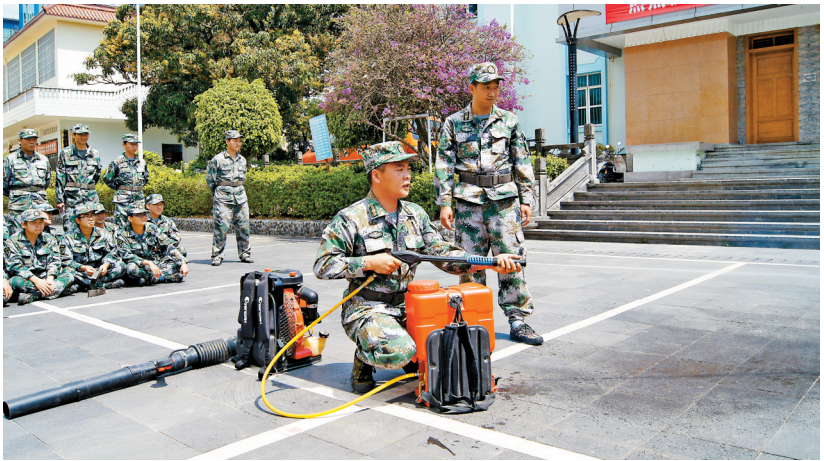
梁河县勐养镇武装部组织民兵演练灭火器使用