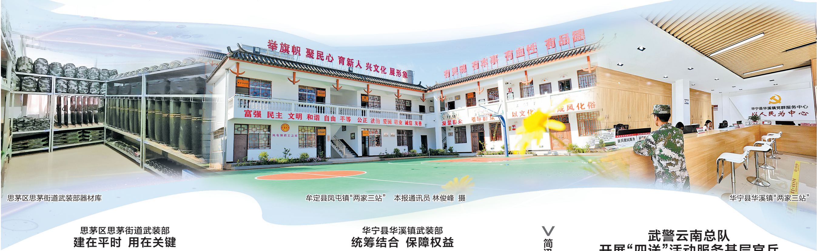
思茅区思茅街道武装部器材库

建基层人民武装部经验做法,现场观摩楚雄州乡镇、高校、企业3类基层人民武装部建设成果,对全省新时代基层人民武装部建设进行再推进、再动员、再部署。会议召开以来,各级各地积极作为、创新方法,认真贯彻落实会议精神“下篇文章”,探索了一些有益做法,引起军地各级重视。