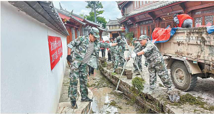
古城区大研街道武装部组织民兵开展河道清淤

勐养镇坚持富民强镇与兴武强兵相统一,把武装工作纳入党委政府中心工作同步部署,既注重在疫情防控、抢险救灾中练兵兴武,又注重在乡村振兴、创建卫生城市等实践中用兵强能。2021年以来,先后组织基干民兵进行义务扑火7场次,开展人居环境整治工作11次,累计动员397名民兵长期参加边境疫情防控,交出了优异的答卷。